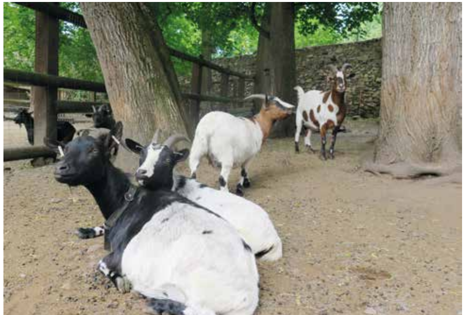
Hradní safari zůstává i nadále otevřeno