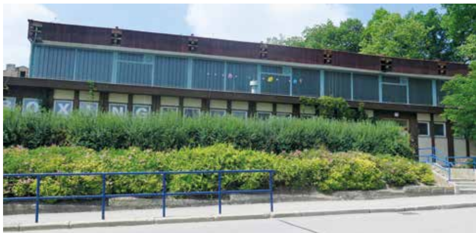
Pohled na sportovní halu z Radomyšlské ulice