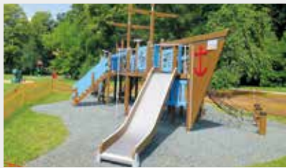
Nový herní prvek na Podskalí

A co děti? Mají si kde hrát...? Jistěže mají. Relaxační zónu na Podskalí doplňuje od minulého měsíce loď. A ne ledajaká. Na Podskalí zakotvila pro radost větších i menších dětí pirátská loď. Doplnila tak již stávající herní prvky, které jsou obzvláště za teplého počasí hojně navštěvovány maminkami s dětmi.