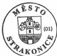
Mgr. Břetislav Hrdlička starosta města Strakonice