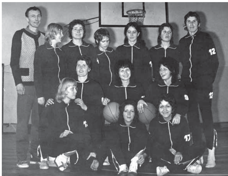
Počátky trenérské práce s ženami ČZ Strakonice v roce 1969.