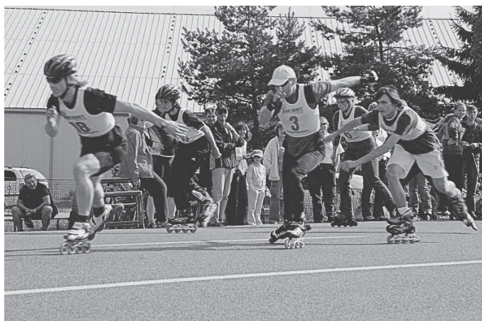
Bruslaři dali do jízd veškeré síly i své srdce a jeli naplno.