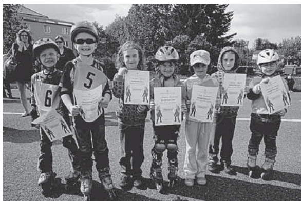
Nejmladší účastníci bruslení dostali na památku pamětní listy.