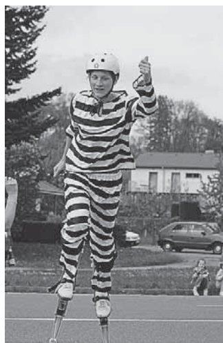
Bruslení zahájilo vystoupení a akrobacie na skákacích botách.