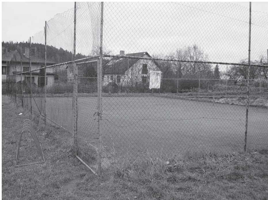
Oplocení hřiště ještě před rekonstrukcí.

Do oblasti tělovýchovy, sportu a ostatních volnočasových aktivit směřovala v roce 2011 z rozpočtu města částka ve výši zhruba 31 mil. Kč. Tento objem finančních prostředků zahrnuje příspěvky jednotlivým sportovním a volnočasovým subjektům, peníze spojené s krytím provozních a investičních nákladů sportovišť spadajících pod správu města a finance určené na budování a úpravu stávajících cyklostezek na území města včetně příspěvku Nadaci Jihočeské cyklostezky.