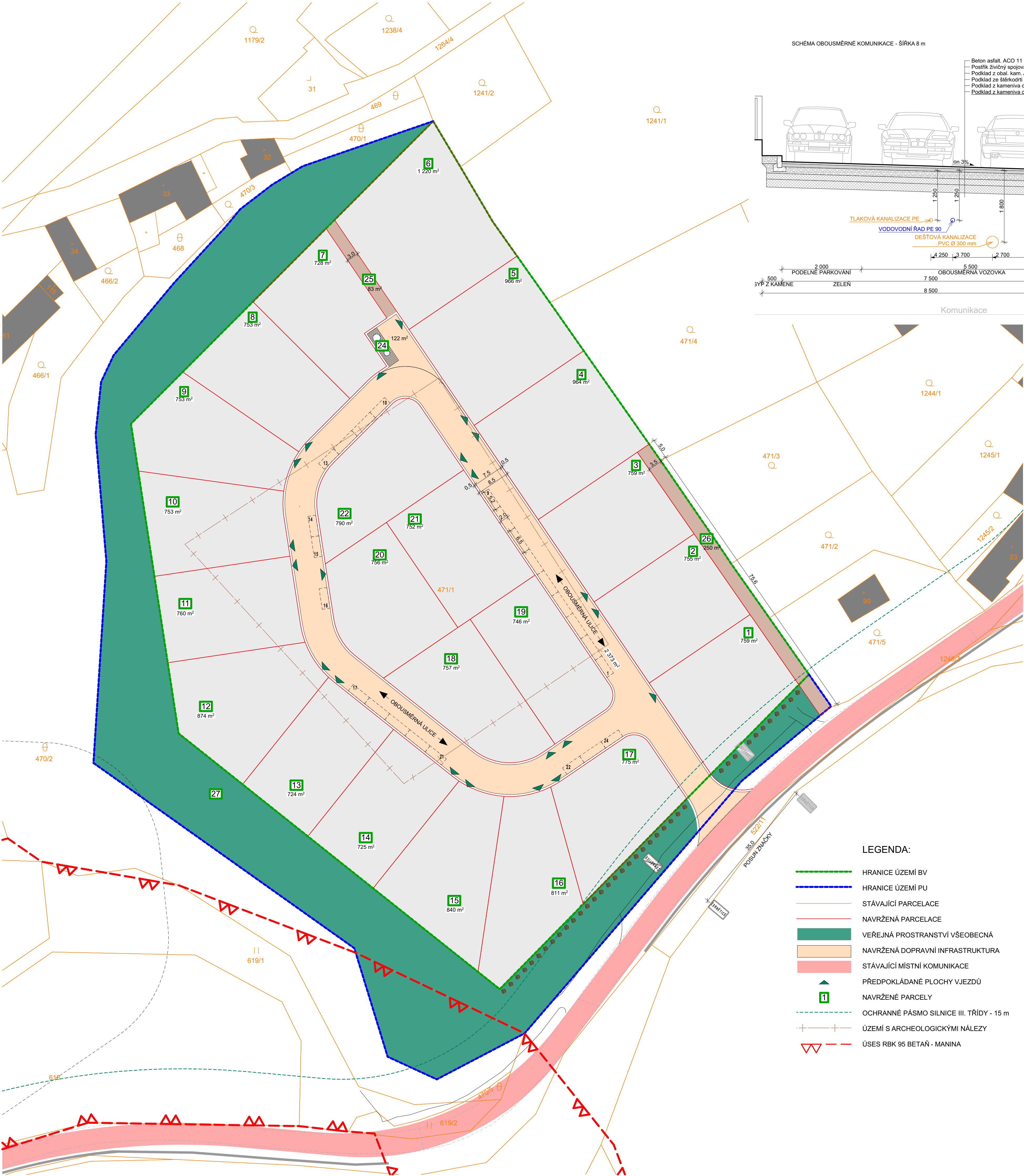
SCHEMA OBOUSMĚRNÉ KOMUNIKACE - ŠÍŘKA 8 m