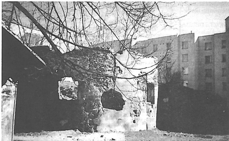
Dochovaný fragment městského opevnění.