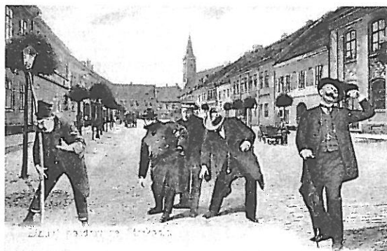
Pohlednice Malého náměstí s rozšafnými mladíky okolo roku 1900.

Při této položce činí komise návrh na obsazení místa čtvrtého strážníka.