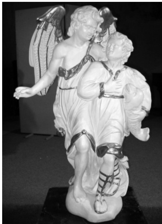
Archanděl Rafael s Tobiášem, dřevěná polychromovaná plastika, 17. století, výška 115 cm, Muzeum Šumavy, Kašperské Hory

Základní umělecká škola přijímá pro školní rok 2005/2006 děti od 6 let do přípravného pěveckého sboru a děti od 9 let do pěveckého sboru. Zájemci se mohou dostavit 2. září od 14 do 15 hodin do budovy ZUŠ v ul. Kochana z Prachové 263 – učebna HN ve 3. patře.