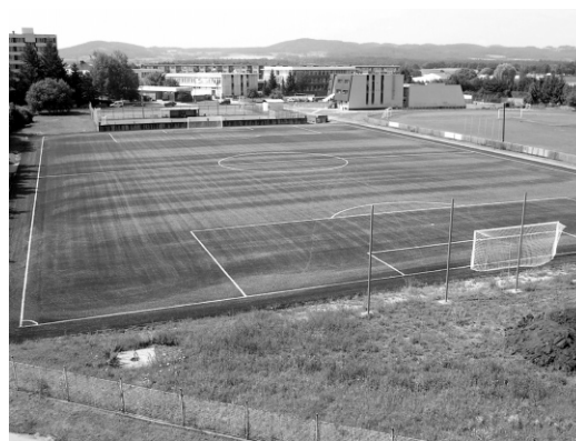
Fotbalové hřiště s umělým povrchem.

Zimní stadion na Křemelce se dočkal v letošním létě několika zásadních oprav – střecha, šatny, zázemí, atd. Protože se sezona prodlužuje, na údržbu a opravy zbývá čím dál méně času. Protože zima nebývá vždy přívětivá pro vyznavače bruslení, rozhodli