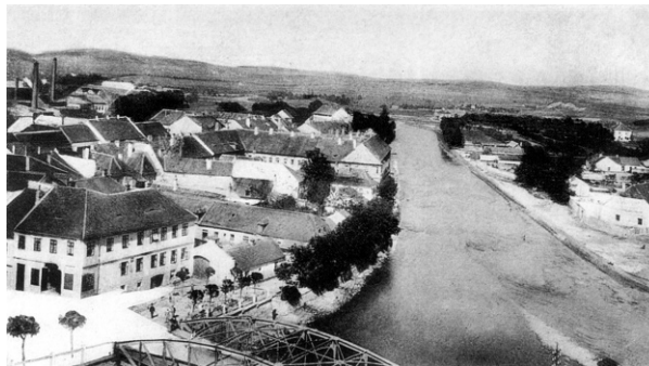
Nábřeží u železného mostu.

Člen pan D o Karel Vorel přimlouvá se vřele za povolení nákladu k upravení nabřeží které se i hned provedstí má dokud se most staví, neb upravení toto jest povinností obce která