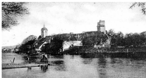
Pohled na hrad s řekou Otavou z roku 1902.