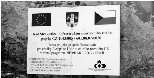
Tabule před hradem informuje o spolufinancování akce z EU.