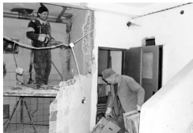
Práce na výstavbě sociálního zařízení jsou v plném proudu.

Kromě finančních prostředků z národního programu Phare získalo město na rekonstrukci hradu ještě další zdroje, a to ze strukturálních fondů EU – společného regionálního operačního programu (dále jen SROP). V rámci projektu s poměrně dlouhým názvem „Obnova a nové využití strakonického hradu pro rozvoj cestovního ruchu na Strakonicku“ budou realizovány projekty na rekonstrukci knihovny (část na II. nádvoří), hradebního příkopu, přilehlého parku a zahradního domku, uzavření hradu od řeky na III. nádvoří. Součástí je i rekonstrukce sítí a přivedení horkovodu do uvedených objektů. Na vlastní realizaci získalo město z programu SROP dalších 14.004.000,- Kč a 2.154.000,- Kč je příspěvek od Jihočeského kraje. Cena díla dle smlouvy s vítěznou dodavatelskou firmou Jihospol, a. s., Strakonice, činí 24.571.151,- Kč (včetně 19% DPH). Termín dokončení je 31. prosince 2006.