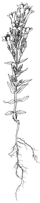
Hořeček mnohotvarý český

Pozdní léto je čas, kdy v naší přírodě rozkvétají hořece. O některých z nich jsme si již vyprávěli. Dnes budeme vě-