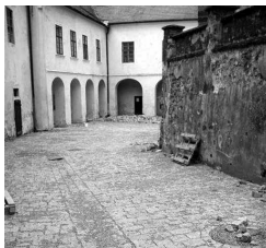
I. hradní nádvoří se již může chlubit novou dlažbou.