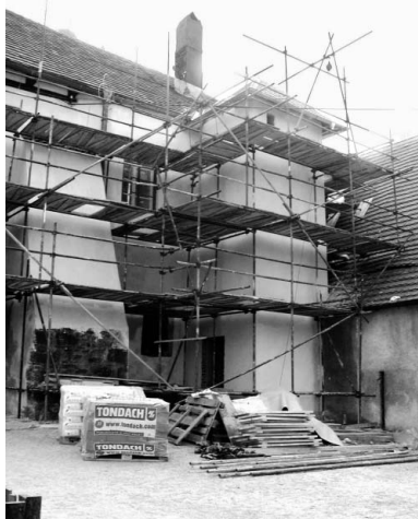
Přístavba výtahu.

Ačkoliv v okolí strakonického hradu již zdánlivě není tak čilý stavební ruch jako v letních měsících, práce intenzivně pokračují zejména v interiérech knihovny a v hradním parku.