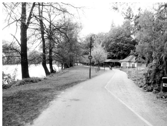
Cyklostezka na Podskalí.

Uvedené poznatky v souvislosti s realizací cyklostezek na území města Strakonice jsou spíše pohledem občana do budoucnosti našeho města, nicméně doufejme, že připravenost a daný plán této problematiky povede k získání možných dotačních titulů a k následné realizaci záměrů v souvislosti s výstavbou cyklostezek a cyklotras na území města Strakonice.