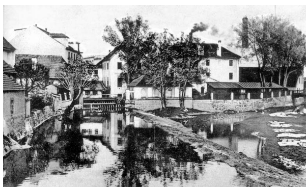
Pohled na tzv. Strakonické Benátky z roku 1907.

Člen pan Vojtěch Kulhánek navrhuje, že obyvatele „Ostrova“ oprávněný nárok činí na zařízení stojanu k čerpání pitné vody, neb říčnou vodu nelze jim pít pro nečistotu a k stojanu pit-