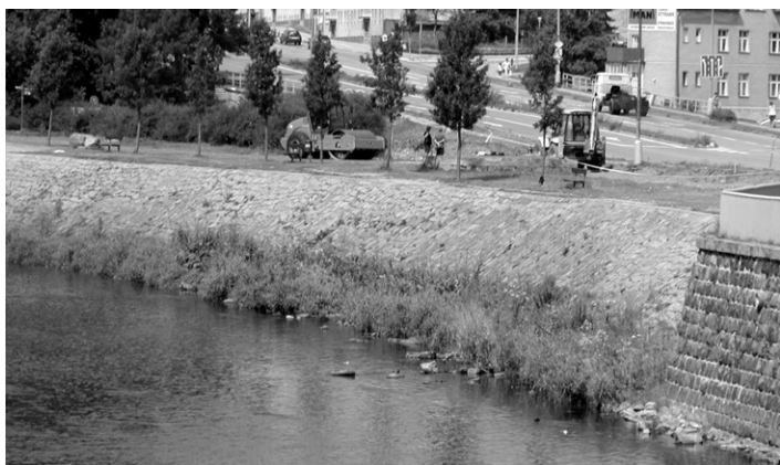
Stavba protipovodňové ochrany centra města.

Město Strakonice plánuje pokračovat ve výstavbě protipovodňových opatření v Ellerově ulici, kde dojde k mobilnímu hrazení podchodu a k osazení zpětných klapek v Mlýnském náhonu.