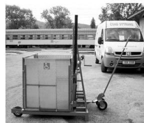
Mobilní plošina pro osoby s omezenou schopností pohybu.

Město Strakonice společně s Českými drahami, a. s., zve své občany ve čtvrtek 13. 9. 2007 od 11,00 hod. na nádraží ve Strakonících na oficiální uvedení do provozu mobilní plošiny pro osoby s omezenou schopností pohybu. Plošina bude využívána k přepravě zmíněných osob z nástupiště do vlaku a zpět. Mobilní plošina byla pořízena za částku 214.200,- Kč. Na její zakoupení přispělo město Strakonice částkou 80.000,- Kč, České dráhy, a. s., částkou 84.200,- Kč a Konto bariéry částkou 50.000,- Kč.