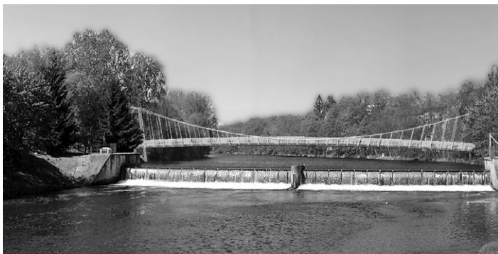
Lávka přes řeku u hradu.

Umístění lávky pro pěší a cyklisty pod soutokem Otavy s Volyňkou se předpokládá mezi mostem Jana Palacha a mostem v Ellerově ulici poblíž hotelu Bavor. Tato lávka by měla být součástí páteční cyklostezky města Strakonice. Druhá lávka přes řeku Otavu v lokalitě strakonického hradu by měla být umístěna nad jezem poblíž parkoviště u měšťanského pivovaru.