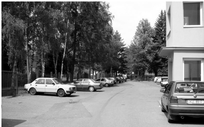
Parkoviště před střední školou řemesel a služeb.

Dojde k doplnění veřejného osvětlení na parkovišti před Střední školou řemesel a služeb Strakonice (bývalé SOU) a v ulici směřující k poště.