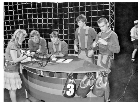
Žáci při soutěži.

Ve dnech 5., 12., a 19. 9. 2007 je možné zhlédnout tým při soutěži v televizi.