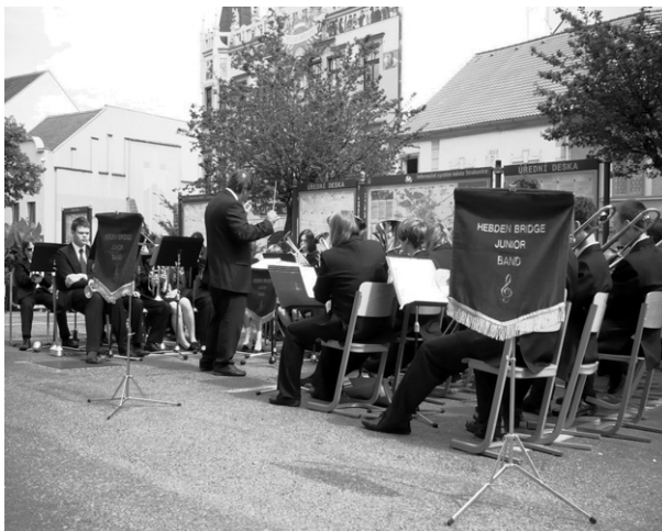
Hebden Bridge Junior Band ve Strakonici.