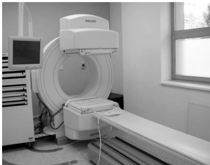
Gamakamera na oddělení nukleární medicíny.