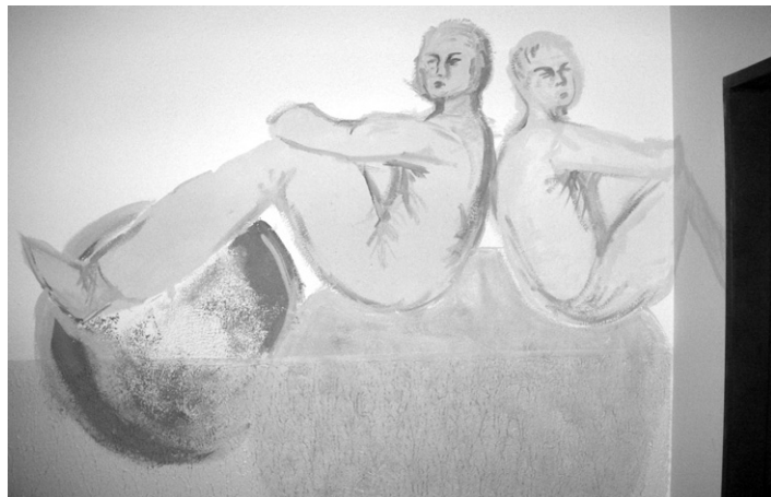
Výzdoba chodby v KKC.

V rámci svých služeb se úzce specializujeme na klienty užívající legální i nelegální drogy, na jejich rodinné příslušníky a známé – to vše v rámci tzv. nízkoprahového zařízení kontaktního centra . Naší snahou je minimalizovat zdravotní a sociální rizika spojená s užíváním drog na straně konzumentů těchto látek (tzv. princip Harm Reduction), na druhé straně je cílem i ochrana většinové společnosti (tzv. princip Public Health). Naše služby jsou k dispozici i klientům, kteří sami aktivně drogy neužívají, ale tento problém jejich život ovlivňuje – jedná se zejména o rodiče, příbuzné a známé uživatelů drog.