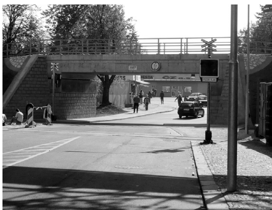
Železniční most před a po rekonstrukci.