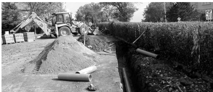
Parkoviště v ulici Hradeckého.

Parkoviště bude vylepšené o veřejné osvětlení, nové obruby a nové asfaltové plochy včetně osázení zelení.