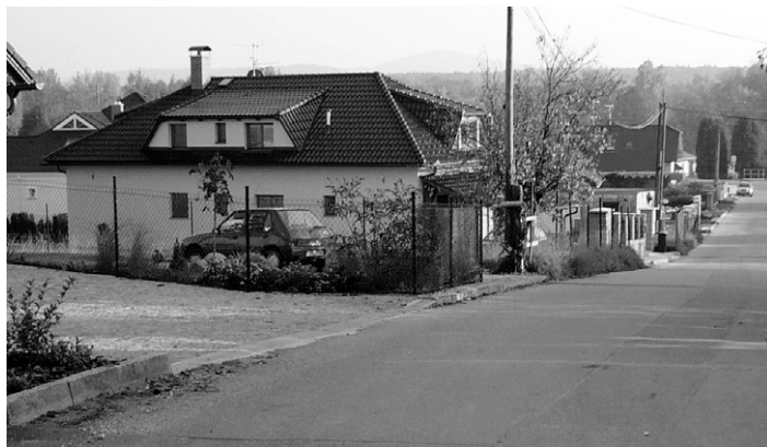
Ulice Na Hrázi v Novém Dražejově.

Dojde k vybudování nových chodníků v místech, kde v současné době jsou pouze silniční obruby. Chodníky budou dlážděny betonovou zámkovou dlažbou a sjezdy budou z kamenných kostek.