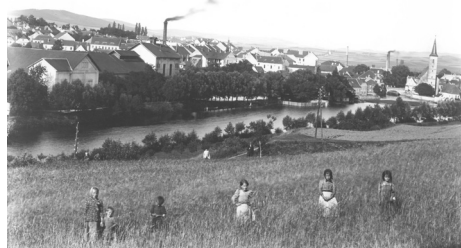
Parotrojní pivovar.

Výstav piva v měšťanském pivovaru v roce 1840 je uváděn 6.737 hl., což je přibližně stejně, jako uvádí jeho konkurent pivovar dominikánský. Ten v důsledku stagnací feudálních výsad začal pomalu ustupovat ze svých pozic a byl později již pouze pronajímán – viz 2. díl. Právováreční měšťané již nadále provozovali pivovar ve vlastní správě a v roce 1866 bylo uvařeno 133 várek po 60 hl. Je uváděno, že z toho byly čtyři várky, převedeno