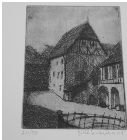
Grafické listy města Strakonice.