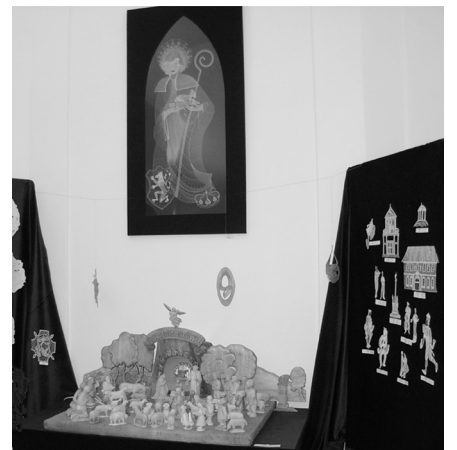
Ukázka z výstavy.

Z. Limbergerová instruktorka sociální péče DS Strakonice