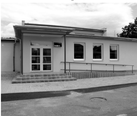
Odbor dopravy nově naleznete v ulici Krále Jiřího z Poděbrad (areál bývalé SÚS).