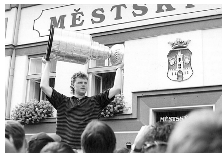
Pohár Stanley Cup v rukách Romana Turka dne 26. 7. 1999.