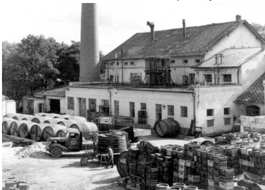
Strakonické pivovarnictví v letech 1964.

Druhá světová válka znamenala pro strakonický pivovar další těžkou zkoušku v jeho historii. Již na konci třicátých let, kdy začínalo být pravděpodobné vypuknutí dalšího válečného konfliktu, přijala správní rada pivovaru některá opatření, která měla za cíl umožnit podniku překonání očekávaných těžkých časů. Patřilo mezi ně hlavně zvyšování zásob surovin potřebných pro výrobu piva – pivovarského ječmene pro výrobu sladu, chmele, cukru a také paliva do kotelny a pohonných hmot pro nákladní automobily. Pořizovalo se bednářské dřevo pro výrobu a opravy sudů, smola pro vy-smolování ležáckých sudů a transportních nádob. Vše směřovalo k tomu, aby byl pivovar připraven k překonání tohoto mimo jiné i hospodářsky složitějšího období. Niže uvedená tabulka výstavu piva