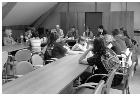
Dětské zastupitelstvo města Strakonice při svém zasedání ve školním roce 2008/2009.