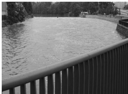
Jez u hradu.

Hlavním záměrem projektu bylo reagovat na slabé stránky a ohrožení města v oblasti protipovodňové ochrany, snížit rizika a zvýšit ochranu osob a majetku (jak veřejného, tak i soukromého). Specifickým cílem projektu byla realizace pasivních prvků protipovodňové ochrany centra města Strakonice. Na základě studií a rozborů bylo zjištěno, že centrum města lze ochránit využitím tzv. pasivního principu protipovodňových opatření – tj. výstavbou ochranných bariér, které zamezí záplavě vytčeného chráněného území (níže položené území města na levém břehu řeky Otavy mezi komunikacemi Katovická a Ellerova).