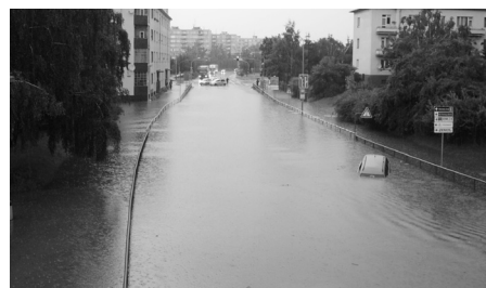
Zatopená ulice u viaduktu.

„Ani lidé bydlící desetiletí ve Strakoncích si nepamatují takový přívalový déšť. Problémy byly všude po městě a pod viadukt se splavil písek, kamení a pak i kůra. Tomu se zabránit nedalo,“ uvedl starosta města Ing. Pavel Vondryš pro MF