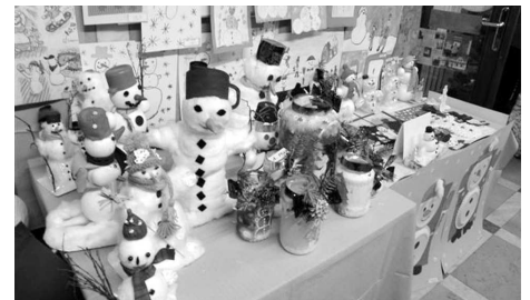
Výstava vánoční soutěže.