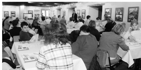
Okamžik z Press tripu.