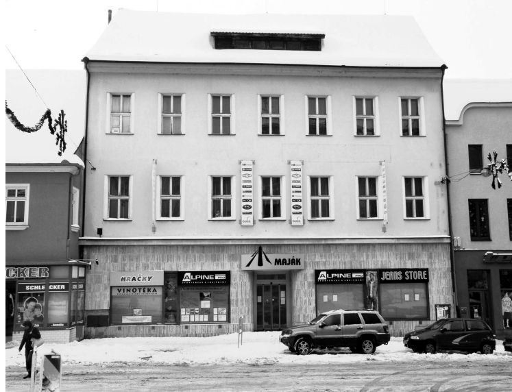
Obchodní dům Maják.