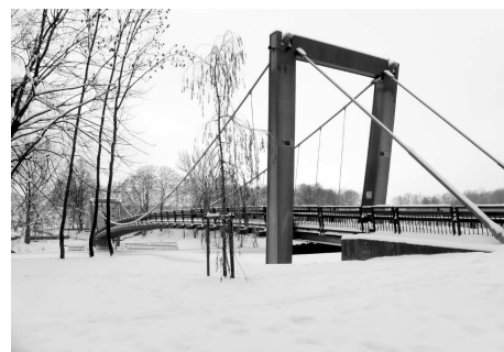
Lávka u hradu.

„Projekt lávky u strakonického hradu není bohužel jediným, který měl v závěrečné kontrole a v následném proplacení dotačních peněz