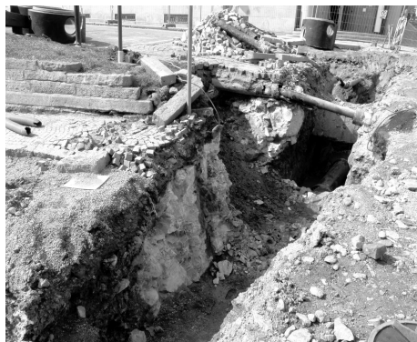
Odkryté základy morového sloupu na Velkém náměstí.