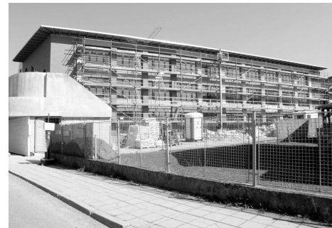
Výstavba nové školy.