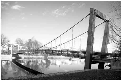
Lávka byla slavnostně otevřena 12. 11. 2009.