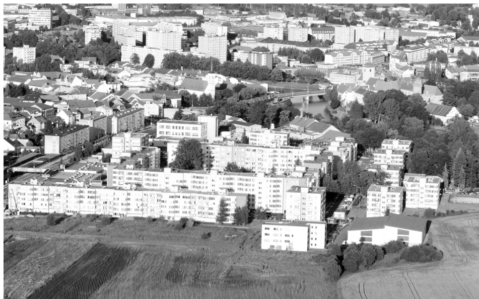
Letecký pohled na Strakonice. V popředí sídliště Mír, kde se v povolovacích řízeních často vyskytují procesní překážky, a proto se stavební záměry i zde realizují obtížně a pomalu.