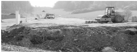
Budování lokality Mezi Lesy.

Kanalizační sběrač o dimenzi 700 mm v délce 105 m vylepší odtokové poměry kanalizace z lokality Habeš a umožní napojení dešťových a splaškových vod z nově budované lokality Mezi Lesy. Stavba bude probíhat v úseku ulice Blatenská do konce června letošního roku.