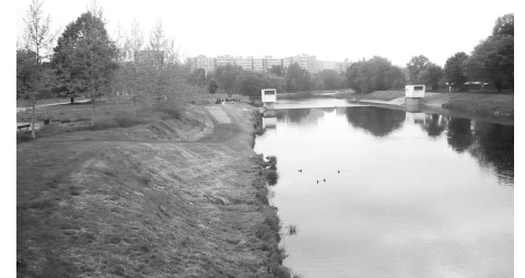
Břehy řeky Otavy po sobotním čištění.