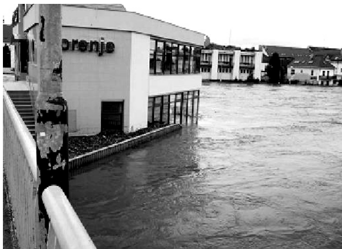
Povodně 2002 – soutok.