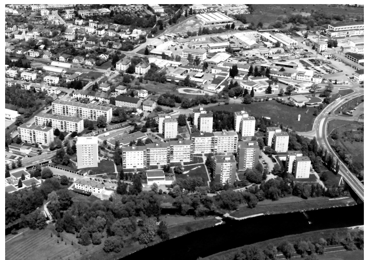
Sídliště 1. máje.

Rada města rozhodla zveřejnit výzvu k podání nabídky na regeneraci Sídliště 1. máje – II. etapa.