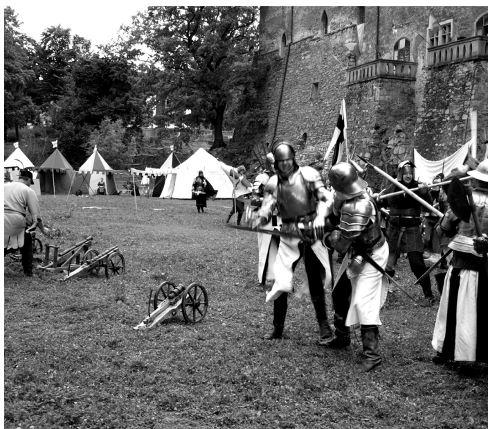
Rekonstrukce bitvy v hradním příkopě.