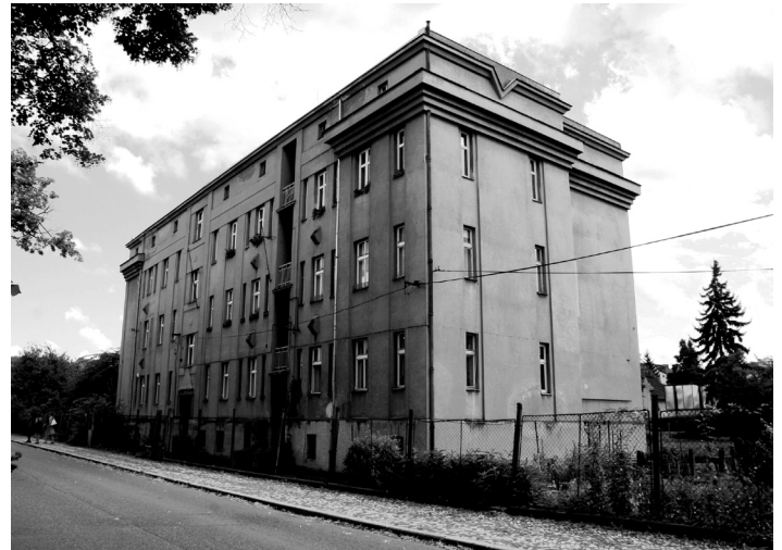
Dům v Tovární ulici.