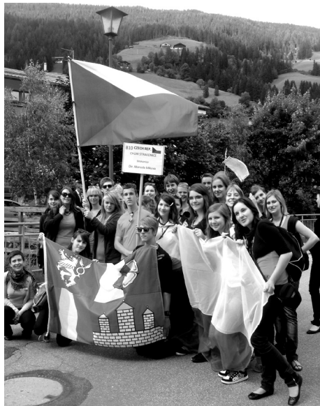
Zpěváci pěveckého sboru.

Velké poděkování patří městu Strakonice a Jihočeskému kraji, jež naši účast finančně podpořily. Díky tomu mohli jet na festival všichni členové sboru. A věřím, že se na festival za dva či tři roky rádi podívají znovu.