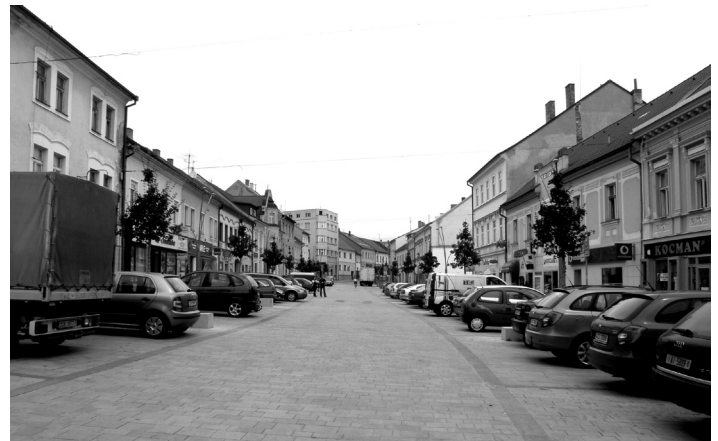
Pohled na současné Velké náměstí.

Parkování samozřejmě ano. Ale omezené dobou stání i počtem parkovacích míst. Pro vyřízení úřadu, banky, zásobování, zadání zakázky, nakoupení, na rychlou kávu s kamarádkou v příjemné předzahrádce prima kavárničky s krátkým, třeba patnáctiminutovým parkováním zdarma (Tábor zlevnil parkování a má dnes 91% ukázněných ři-