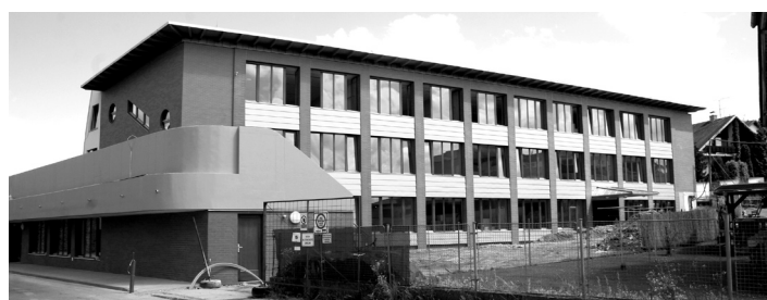
První etapa výstavby školy je u konce.