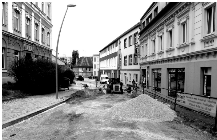
Práce v ulici Kochana z Prachové.

turnaji trojic mužů a dorostu v nohejbalu v Habeši dne 27. 8. 2011, 20 000 Kč TJ ČZ Strakonice na 17. ročník Běh městem dne 21. 8. 2011, 5 000 Kč oddílu plaveckých sportů při TJ Fezko Strakonice na náklady pořádaním mezinárodního turnaje ve vodním pólu Czech Open na plaveckém stadionu ve dnech 28.–31. 7. 2011, 2 000 Kč Aeroklubu Strakonice, o. s., na náklady spojené s odletanými hodinami při para soutěži v přesnosti přistání na letišti a plaveckém stadionu ve dnech 30.–31. 7. 2011, 2 000 Kč Aeroklubu Strakonice, o. s., na částečné náklady při XXV. ročníku Strakonický fez na letišti ve dnech 23.–25. 9. 2011, 2 000 Kč SK Basketbal Strakonice na náklady na rozhodčí při přípravném turnaji dorostu U16 a U18 ve sportovních halách ve dnech 10.–11. 9. 2011 a 2 000 Kč na přípravný turnaj žáků ve sportovní hale STARZ ve dnech 24.–25. 9. 2011, 3 000 Kč oddílu házené při TJ ČZ Strakonice na ceny a rozhodčí při souboji turnajů v házené v házenkářské hale ve dnech 4. 9. a 28. 9. 2011, 13 000 Kč České táborské unii, TK Podskalí Strakonice na cestovné a drobný materiál při táborské škole na táborové základně Kadov u Blatné ve dnech 17.–31. 8. 2011 a 5 000 Kč Tenisu klubu Strakonice, o. s., na ceny při celostátním turnaji na tenisových kurtech, a to konkrétně mladších žáků a žákyň ve dnech 30. 7.–1. 8. 2011, babytenise dne 3. 8. 2011, starších žáků a žákyň ve dnech 13.–15. 8. 2011.