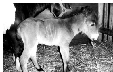
První narozené hříbátko ve strakonickém safari.