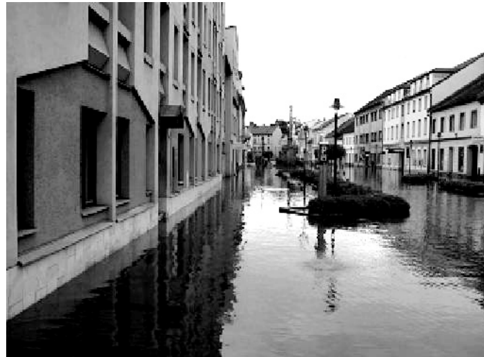
Povodně 2002 – Palackého náměstí.

Zahájení stavby proběhlo v úterý 28. 6. 2011, kdy bylo předáno staveniště zhotoviteli stavebních prací společnosti HOCHTIEF CZ, a. s., a společnosti BETVAR, a. s., – oba účastníci sdružení PPO města Strakonice. Ukončení stavebních prací je smluvně stanoveno na 31. 12. 2012. Celkové náklady výstavby činí 97 084 212 Kč, přičemž investor stavby Povodí Vltavy, státní podnik, Praha získal na stavbu dotaci z programu ministerstva zemědělství ve výši 80 mil. Kč. Město Strakonice se podí-