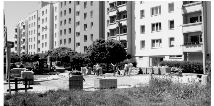
Práce při první etapě revitalizace.

zového štábu ORP Strakonice předány starostou města jmenovací dekrety. (PR)