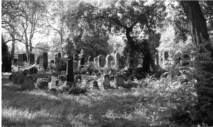
Židovský hřbitov se nachází u silnice na Pracejovice.

Kolem hřbitova je vysoká kamenná zeď, která měla zaručit ochranu hrobů před znesvěcením. V čele hřbitova stojí malý domek, který plnil funkci márnice, v rohu je zřízena pumpa k symbolickému