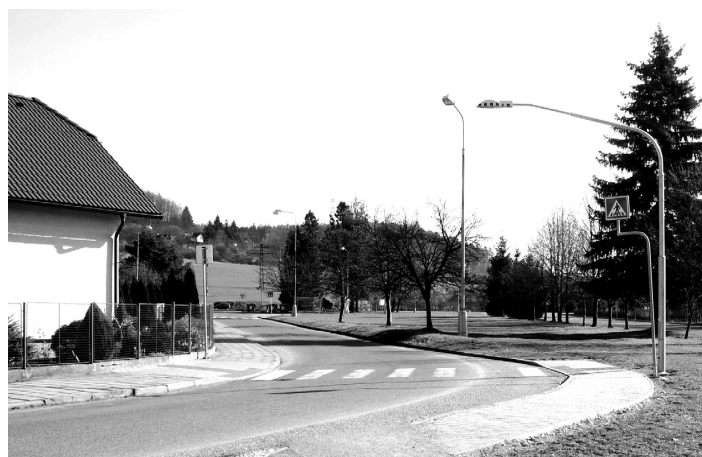
Bezbariérový přechod s nasvětlením v ulici Mikoláše Alše.

Rychlou, správnou a profesionální práci považují oprávněně někteří klienti za samozřejmost, ale bohužel jen do okamžiku, kdy je výsledek řízení pro ně příznivý. Jestliže však nevyhovuje jejich zájmům, shledávají to jako podjatost úředníka, či útok na demokratické principy a svobodu podnikání. Pojem demokracie si vysvětlují neochotou respektovat zákony a platnou legislativu. Stížnosti, žaloby a trestní oznámení jsou běžnou součástí komunikace ze strany těchto klientů. I díky mediálnímu obrazu úředníků, kteří jsou často nesmyslně spojováni s neoblíbenými politiky, je v očích veřejnosti naše práce často znevažována a diskreditována. (PR)