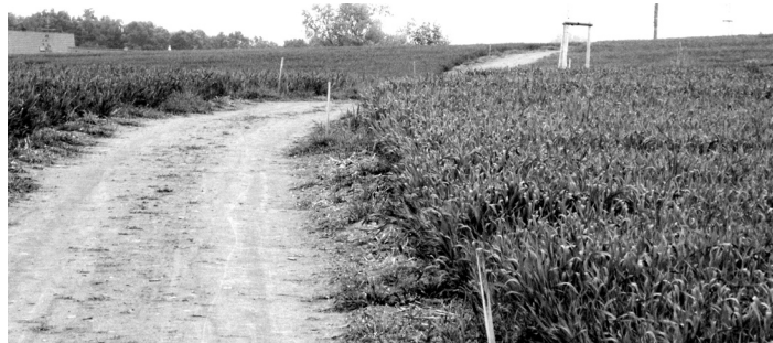
Okolí Strakonice je jako stvořené pro červnové vycházky. Vydat se můžete třeba po cestě, která byla po letech obnovena v polích mezi Novým Dražejovem a Střelou.

Dále 15 000 Kč Dušanu Vávrovi na vydání publikace o osudech občanů okresu Strakonice, kteří bojovali na západní frontě během II. světové války, 10 000 Kč Prácheňskému souboru písní a tanců Strakonice na vydání vánočního CD, 3 000 Kč Sdružení hasičů ČMS okresu Strakonice na realizaci projektu Požární ochrana očima dětí 2012, 4 000 Kč Osadnímu výboru Modlešovice na úhradu nákladů spojených s pořádáním Dětského dne 9. 6. 2012, 2 000 Kč Přátelům MC Beruška Strakonice na uspořádání zábavného odpoledne v rámci kampaně Táta dneska frčí dne 16. 6. 2012, 10 000 Kč Dětskému pěveckému sboru Fere Angeli ZUŠ Strakonice na mezinárodní festival pěveckých sborů 15th Alta Pusteria Internationalchorfestival v Itálii ve dnech 21.–24. 6. 2012, 20 000 Kč ZŠ Dukelská na reciproční výměny žáků se švýcarskou základní školou z Lengnau ve dnech 18.–22. 6. 2012 a 17.–21. 9. 2012, 10 000 Kč Euroškole Strakonice, s. r. o., na účast při 7. ročníku mezinárodního workcampu studentů v německém Bad Salzungenu ve dnech 20.–25. 5. 2012.