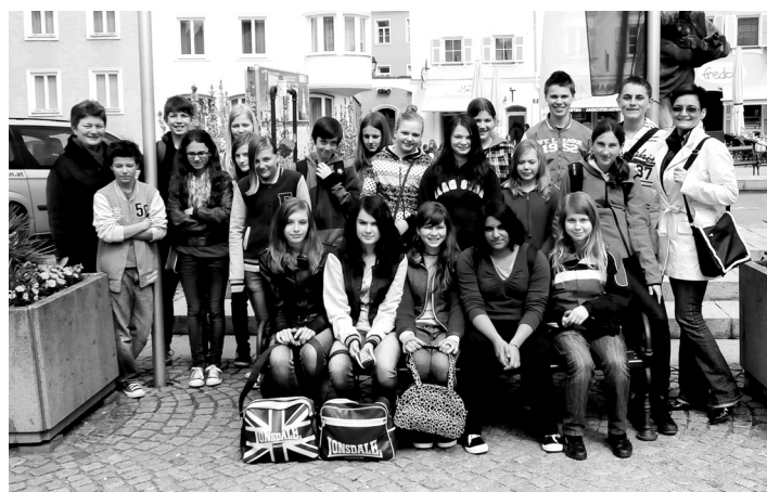
Okamžik z výměnného pobytu.

Poslední den začal opět výukou ve třídách našich kamarádů. Ve třetí vyučovací hodině jsme se sešli už všichni v jedné třídě a proběhla v kruhu bouřlivá diskuze v německém jazyce, kde jsme si vyměňovali dojmy o pobytu. Pak jsme si prohlédli zbytek prostor nové taufkirchenské školy, ze kterých nás nejvíce zaujala tělocvična