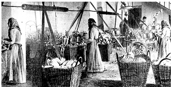
Strojové počesání fezů u firmy W. Fürth & Comp. podle rytiny z roku 1872.

stříhačům náležela poslední úprava sukna postříhování nerovných vlasů. Kráječ nebyl krejčí, ale obchodník se sukrem (tzv. suknozářec). Přestože o rok později bylo ve Strakonici založeno dalších 9 cechů, cech soukeníků vzkvétal nejvíce. V roce 1484 měl již 100 tovaryšů. Založením tohoto cechu byl tak učiněn první krok k dlouhé historii textilního průmyslu ve městě.