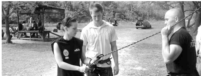
Akce zaměřená na prevenci kriminality.

– V ranních hodinách dne 5. 5. byla na služebnu předána igelitová taška, ve které bylo větší množství peněz, doklady, klíče od domu, i od vozidla a karta do bankomatu. Vše ještě týž den putovalo do rukou majitelky.