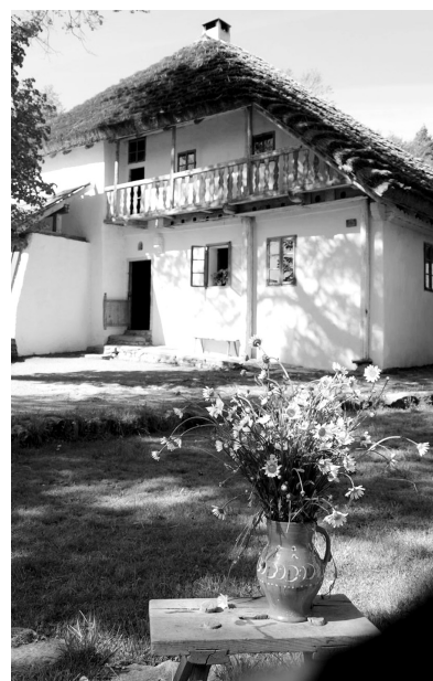
Volný čas můžete strávit i v hoslovickém mlýně.