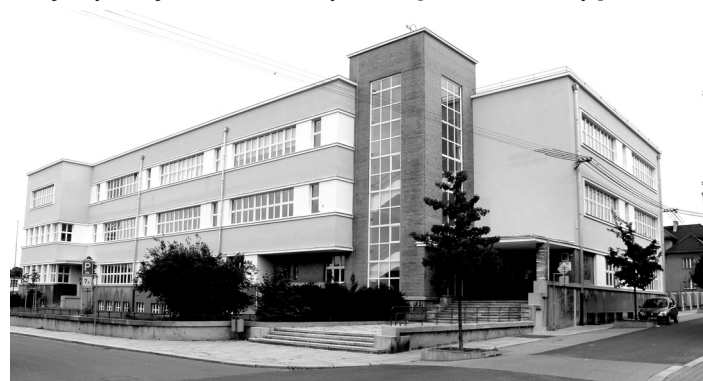
Budova školy prošla řadou oprav a úprav.

vě řešeny opravy jen poškozených částí fasády. Důležitou novinkou byla přístavba výtahu, díky kterému je nyní zajištěn bezbariérový