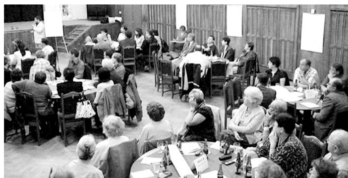
Strakoničtí diskutovali u kulatých stolů nad palčivými problémy města.

Revitalizace prostoru v okolí základní školy v Jezerní ulici byla vyhodnocena jako prioritní téma účastníky šestého diskuzního Fóra Zdravého města Strakonice. To se uskutečnilo 4. června 2012. Šekem na deset tisíc korun bude letos podpořena činnost skautů. Jakoby jarní termín přihnál tradičnímu fóru vítr do plachet. K debatním stolům zasedla více než