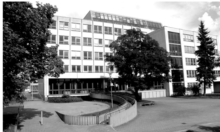
Jedna z budov nově vzniklé školy.

zení. Na jeho počátku musel bezesporu stát dosud zčásti opomíjený Den otevřených dveří, který se uskutečnil již 24. 1. 2012 a rozhodně celkovým výsledkům přijímacího řízení na naší škole výrazně napomohl. Důležitým styčným bodem obou zaniklých vzdělávacích organizací, který posílil celkový efekt přijímacího řízení, byl v tomto směru rovněž fakt, že obě spojovaly svoji vzdělávací činnost