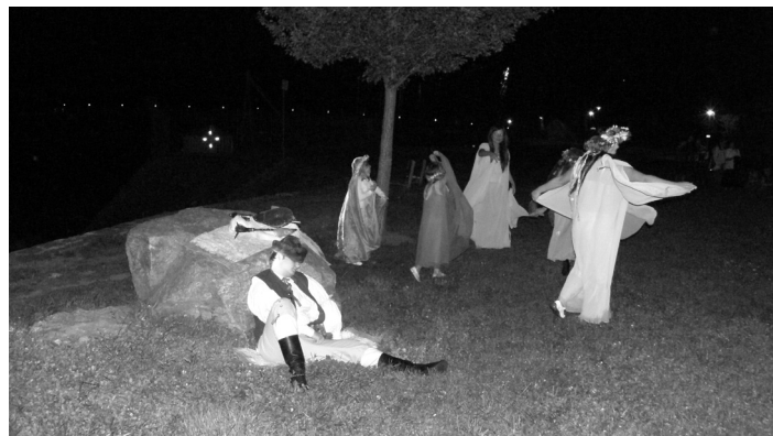
Atmosféra úplňku z minulého ročníku.

Vyprávění začne u Švandy na Velkém náměstí ve 21.00 hodin.