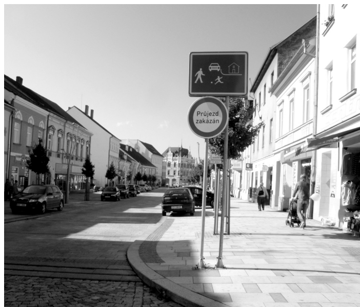
Značka má zamezit tranzitní dopravě.