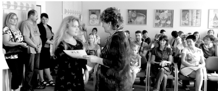
Slavnostní předávání certifikátů ve velké zasedací místnosti MěÚ.

„Získaný certifikát je nejen oficiálním potvrzením jazykových znalostí, ale především velkou motivací k dalšímu rozvoji v této oblasti. Znalost jazyků je v dnešní době již