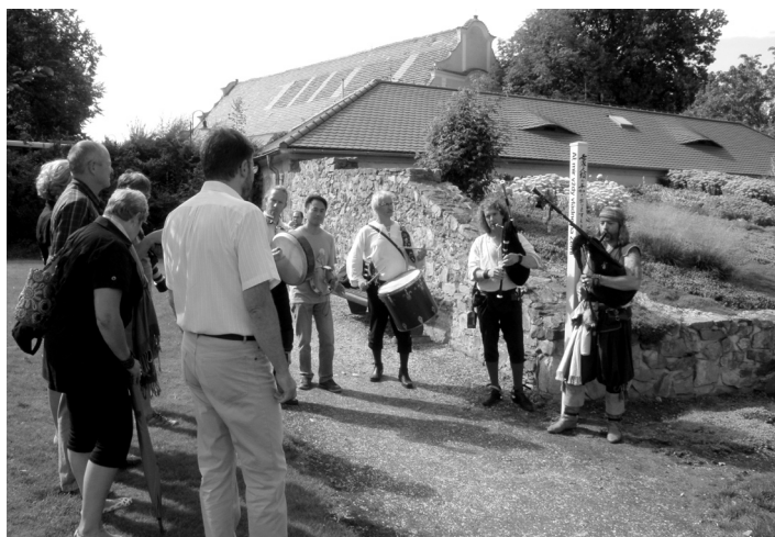
Mírovou tyč od skupiny Hailander najdete v parčíku za hradem.

selství ve čtyřech jazycích. Česky, holandsky, keltsky a japonsky si můžete přečíst přání „Ať mír vždy vládne na Zemi“. Jak potvrdili sa-