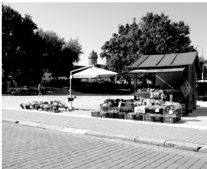
Plocha tržnice u kostela Sv. Markéty je již upravená, na konečnou podobu si však ještě musíme počkat. Město prozatím vyšlo vstříc někdejšímu trhovcům, aby zde ještě mohli nabízet své zboží do doby nákupu nových stánků.