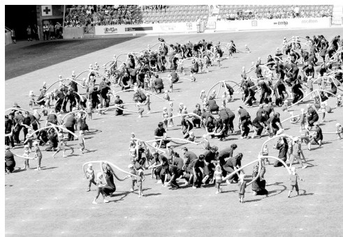
Oslavy 150. výročí založení Sokola v Praze na Strahově.