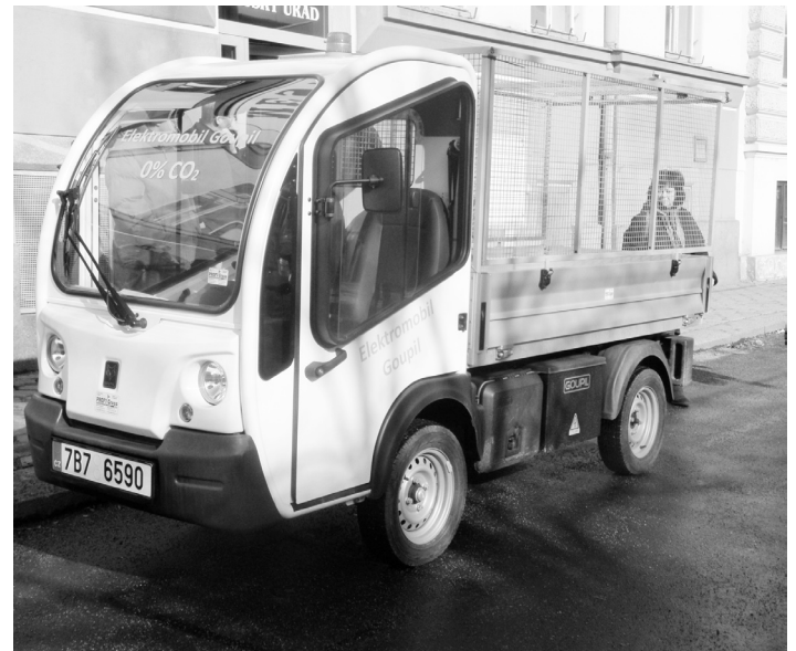
Zkouška elektromobilu v zimních podmínkách. Elektromobil by mohly technické služby města v budoucnosti využívat jako jednu z alternativních možností.