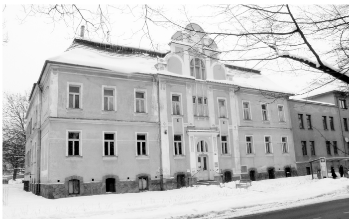
Dům v Husově ulici byl prohlášen za kulturní památku.

Základní účel stavby však stále připomíná neorenesanční štuková výzdoba uliční fasády s vyobrazením Krista s dětmi v obloučkovém štítu. Město, které objekt vlastní od roku 2002, o jeho zařazení mezi kulturní památky požádalo v srpnu loňského roku. Důvodem byla skutečnost, že v případě kladného rozhodnutí bude snazší sehnat dotační prostředky na kompletní rekonstrukci, která je již velmi po-