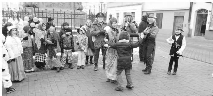
Strakonice žily masopustním veselím.

doprovázený muzikou v podání vodníků měl dvě pozastavení. Na Palackého náměstí u morového sloupu, kde si masky mohly zatančit, a poté před radnicí. Zde už čekala paní místostarostka, která průvod přivítala, nabídla tradiční masopustní koblihý a pře-