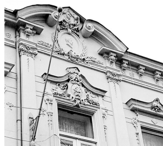
Město Strakonice se zřejmě stane novým vlastníkem kulturní památky nacházející se v blízkosti centra města – místní sokolovny.

Samozřejmě, že bychom usilovali o dotace, tak jako u jiných projektů. Od toho se ostatně případně další stavební práce přímo odvíjejí. (PR)