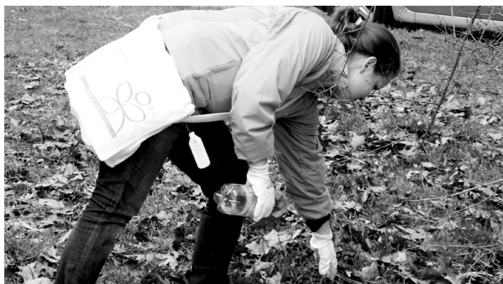
Do úklidu se zapojilo přes sto dobrovolníků.

V květnu se mohou dobrovolníci zapojit v rámci kampaně „Uklidme svět!“ například do čištění řeky Volyňky. Informace jsou na www.strakonice.eu/zdravemesto . (PR)