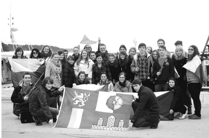
Pěvecký sbor strakonického gymnázia se účastnil začátkem dubna festivalu v Chorvatsku.

klarinetů a houslí, za což si sbor odvezl domů zlatý diplom. Završením chorvatského festivalu byl průvod Poreči, ve kterém každý sbor ukázal temperament sobě vlastní. Ovšem to by nebyl správný strakonický sbor, aby si neza-