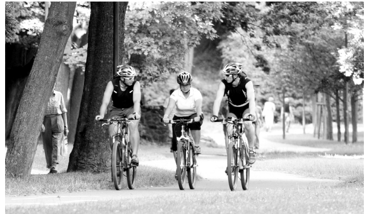
Cyklostezka na Podskalí.

Strakonice má své zastoupení v její pracovní skupině. „Nadace pořádá nebo se podílí na řadě akcí, v některých případech zajišťuje i bezplatnou dopravu. Záleží samozřejmě na dostatečném počtu účastníků,“ říká Jaroslav Bašta.