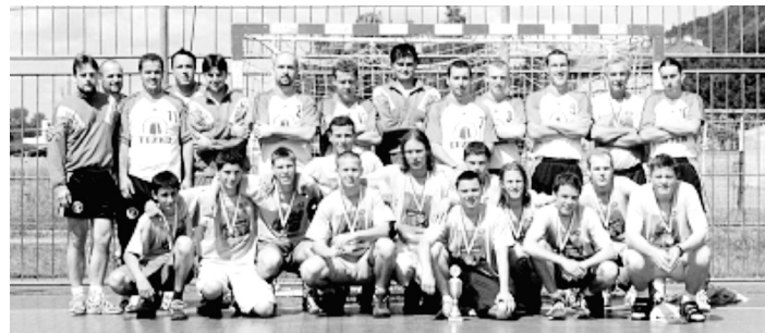
Společné foto družstva mužů a mladších dorostenců (vítězů mezinárodního turnaje Quirinus Cup 2002). Porovnejte, paradoxy! Z té horní řady mužů už v házené nefigurují pouze dva, z tehdy výtečných mladíků v dolní řadě zůstali dodnes u házené pouze tři!!!

Strakonice tak mají v roce 2000 v ligových soutěžích 6 družstev, a to má v této republice pouze Zlín. Všechna družstva si na hřišti vybojovala setrvání v ligových