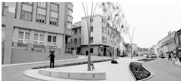
Do barev se obléklo v dubnu Velké náměstí ve Strakonících. Opatřeny byly cibuloviny a macešky.