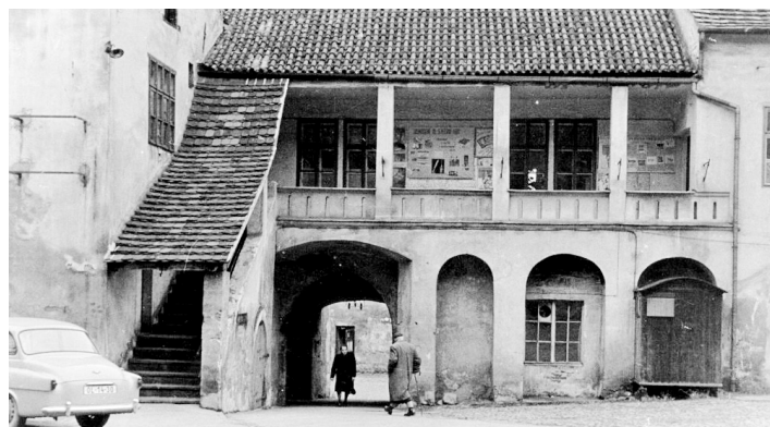
Dobový snímek knihovny.

zval každé obci zřídit a udržovat veřejnou knihovnu. Do dnešní doby tak patříme k zemím s největším počtem a nejhustější sítí veřejných knihoven. I ve Strakonících a okolí vznikaly nové knihovny, knihovníci se setkávali, vzdělávali a za svou práci začali také dostávat odměnu. V roce 1938 byly zpracovány a vytištěny první seznamy knih, aby si čtenáři měli z čeho vybírat. Knihovna sídlila v obecné škole na náměstí (Maják) a měla téměř 8 000 svazků.