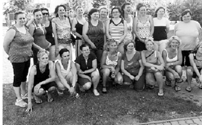
Tahle krása je také součástí oddílu házené, maminky pomohou, kde je potřeba, a hlavně fandí...

Ve 44. ročníku turnaje Kappelberg v německém Hofenu jsme při 22. startu vyhráli turnaj elitní skupiny a potvrdili, že družstvo