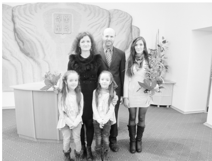
Chepteovi se stali občany České republiky.

ka odjeli za prací společně v roce 1999. On pracoval jako dělník na stavbách, jeho žena šila potahy na volanty. O rok později si s sebou přivezli i svou tehdy šestiletou dceru, která zde začala chodit do školy. Rodina žijící ve Volyni se v roce 2007 rozrostla o dvojčata Nikolu a Natálii. Ty dnes chodí do školky, starší sestra studuje vyšší odbornou školu, rodiče pracují