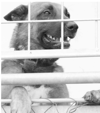
Za šest let nalezlo v útulku pomoc 1600 psů.

V naší práci nám pomáhá mnoho lidí, každý podle svých možností. Nejčastější (a pro nás důležitá) je pomoc materiální. Ať už se jedná o malý jednorázový příspěvek nebo pravidelný přisun žrádla, pamlsků, hraček, dek, oblečků, obojků, vodítek, prostě všeho potřebného. Ti, kteří nemají možnost se k nám