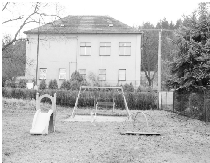
Nové herní prvky na dětském hřišti na Podsrpu.