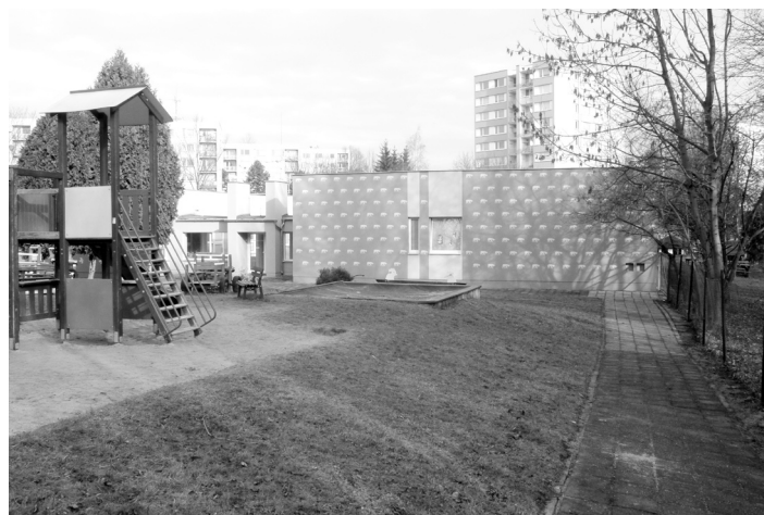
Tuto zimu již v zatepleném „kabátě“ ozdobeném Čapkovými motivy zvířátek je Mateřská škola Lidická.