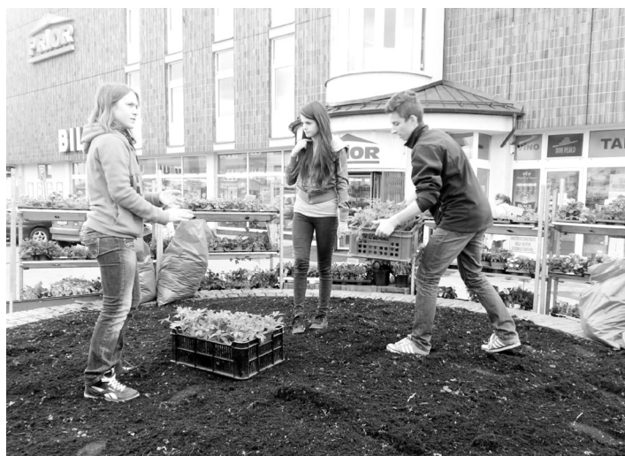
Dětský zastupitelé sázeli květiny.

Největší akcí celého roku byl společný jarní úklid. Díky tuhé zimě sice panovala obava, zda bude v daný čas město bez sněhu. Do akce ve čtvrtek 11. dubna vyrazili opět dobrovolníci z úřadu, přidaly se technické služby, dobrovolníci z neziskových organizací i jednotliví občané. Na závěrečném společném pečení vřutů na „cir-