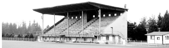
Tribuna bude opět v letošním roce zpřístupněna divákům.

V rámci projektu dojde k rekonstrukci zastřešení a k opravě nosných betonových sloupů tribuny fotbalového hřiště Na Sídlíšti. Oprava by měla být provedena do letošního konce května.