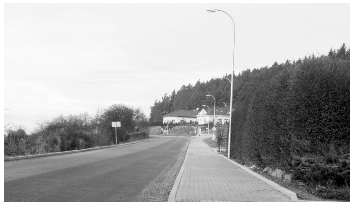
Motoristé i chodci přivítali opravenou cestu ze Strakonice do Starého Dražejova. Na této akci se město podílelo vybudováním chodníků, autobusových zálivů a veřejného osvětlení.

U stavebních úprav objektů na Velkém náměstí a ÚV Pracejovice probíhá stále realizace, ostatní stavby jsou již dokončeny.