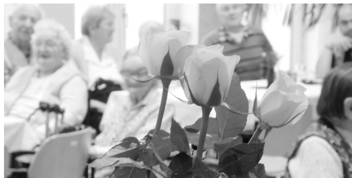
Růže jako dárek těm, co nezištně pomáhají.

boj do života zdejších seniorů. První společné setkání dobrovolníků, sociálních pracovníků i klientů domova se uskutečnilo na počátku ledna. Více o strakonických dobrovolnících a dobrovolnictví přineseme v březnovém Zpravodaji. (PR)