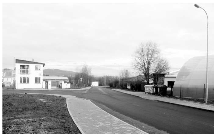
Nové komunikace v průmyslové zóně Na Jelence umožní její lepší využití. Letos by zde měla začít stavět nová závody firma Denios.