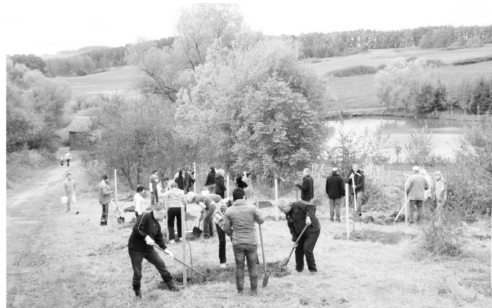
Proběhly jarní a podzimní výsadby ovocných stromů.

Už teď můžete přemýšlet o tom, čím přispějeme k čistějšímu a krásnějšímu Strakonici v letošním roce. Určitě by pomohlo si Strakonice neznečistovat, spíše než následně čistit, ale to je běh na dlouhou trať. Můžete tedy opět počítat s jarním úklidem, pokusíme se ke spolupráci přizvat i osadní výbory a další skupiny obyvatel. Přípravován je opět Společný