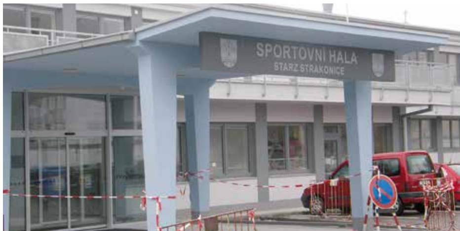
Poslední úpravy vstupu do sportovní haly.

Víte, tak jako asi všude jsou tři skupiny rodičů: ti, co sami sport aktivně provozují a jejich děti se jaksi automaticky přidají, to je model sportovně založených rodin, kde si asi něco jiného můžeme jen stěží představit. Tato skupina rodičů je v podstatě tvůrcem sportovní vize. Druzí jsou ti, co sport rádi sledují, občas si zasportují, ale nejsou aktivními účastníky. V takových rodinách se jistá představa o sportu naplňuje. Třetí skupinu tvoří rodiče, kteří sport nemají jako prioritu, ale děti k němu vedou. Nemají vytvořenu ucelenou představu, ale jejich vizí je sport dětem přiblížit. Město jako majitel sportovních zařízení společně se STARZem musí hledat vhodnou kombinaci a nabídku pro všechny tři jmenované skupiny. Ne každý bude jednou vrcholovým sportovcem, ale to ještě neznamená, že sport spojený se zdravým pohybem nebude v životní náplni těchto lidí, naopak musíme se snažit nabídnout varianty lehčí a náročnější verze sportu. Proto vzniká společně s odbornou firmou dlouhodobá koncepce rozvoje sportu na základě studie volnočasových aktivit, tak aby byla navržena smysluplná linie dalšího rozvoje a nabídky sportu ve Strakonících.