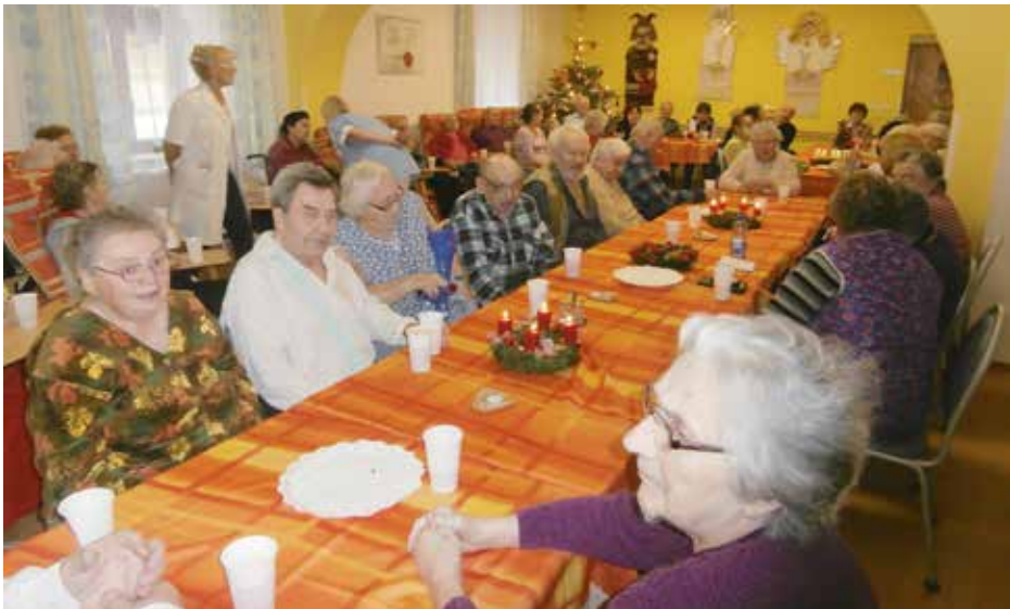
Společné posezení seniorů v domě pro seniory v Lidické ulici.