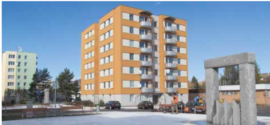
Náměstíčko s fontánou na sídlišti Mír.