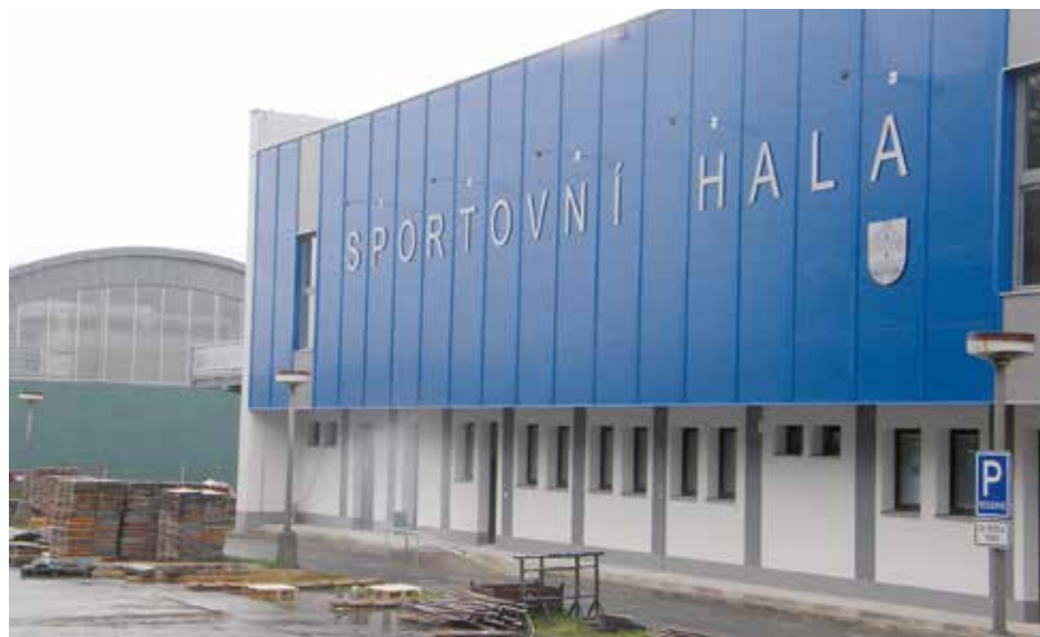
Nově zrekonstruovaná sportovní hala.

Rekonstrukce sportovní haly byla v říjnu úspěšně dokončena kolaudačním řízením.