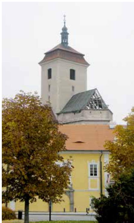
Odkryté trámů presbytáře kostela.

Kostel sv. Prokopa byl původně zasvěcen sv. Vojtěchovi. Jedná se o románský kostel s barokní přestavbou a rokokovými prvky. Jeho barokní interiér je převážně z let 1720–1730.