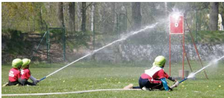
Požární útok v podání nejmladší kategorie

Rosteme, stoupáme a s našimi soutěžícími i zrajeme. Číselná řada 14 – 20 – 28 – 32 – 40 – 37 – 37 – 35 – 39 – 43 představuje celkové počty zúčastněných družstev v letech 2008 – 2017. Začínali jsme se 14 družstvy, minulý ročník byl početně rekordní. V průměru to znamená 32,5 družstva na každý rok. Jsme nejnavštěvovanější dětskou soutěží v okrese. I letos počítáme s více než čtyřicátou týmy. Rostou i nároky na finanční a materiální zabezpečení soutěže. Těší nás, že jsme se