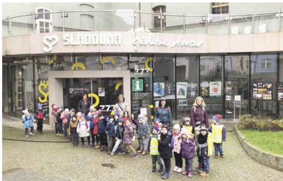
Výlet dětí do Sladovny v Písku