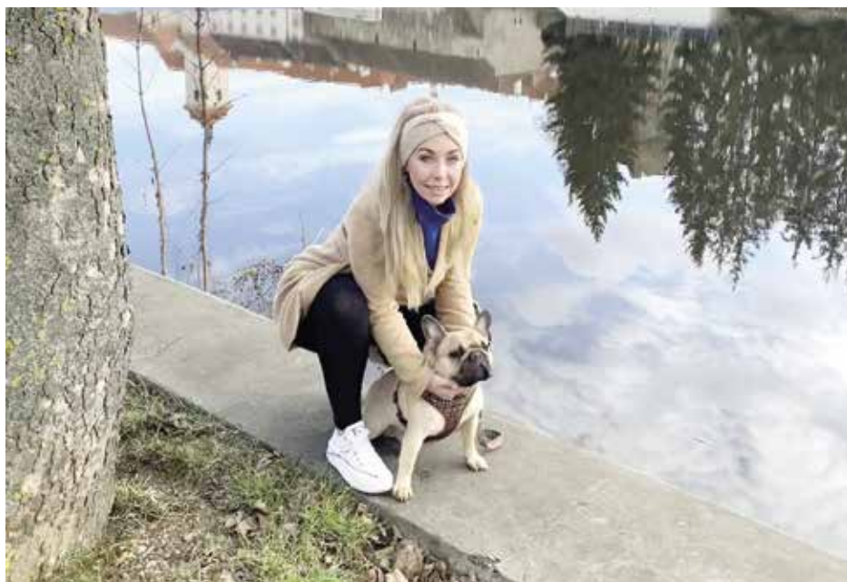
Procházky s chlupáči zvednou náladu, někdy i adrenalin

A tak, když se unaveni vracíme do svých domovů, bezpečně nám zvednou náladu bezelstné psí oči.