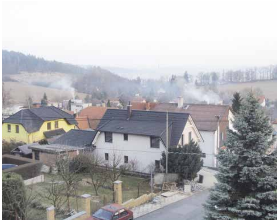
Pojďme společně dýchat čistější vzduch...