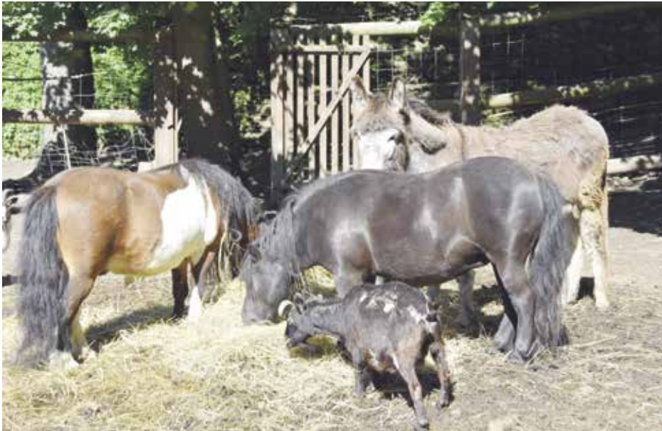
Zvířata ve výběhu jsou cílem mnoha rodin s malými dětmi

Strakonické safari je vyhledávanou atrakcí zejména pro děti, které se v samém srdci města mohou potkat se zvířátky, obvykle obývající venkovská