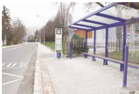
Zastřešená zastávka zpříjemní čekání