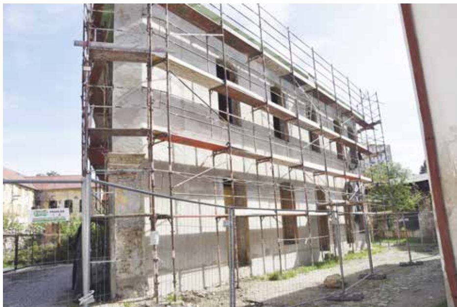
Zakonzervovaná stavba komunitního centra

Smyslem komunitního centra bude zajišťovat sociálně aktivizační služby,