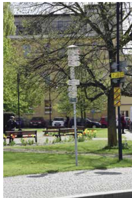
Rozcestník místních turistických tras

Další žlutá trasa začíná u strakonického nádraží, podchodem překonává koleje a podle hřbitova pokračuje do Předních Ptákovic. Vystoupáme do většiny kopce, otevřou se nám pěkné výhledy. Lesní cesta pak klesá k pile a od ní nás dovede silnice do Zadních Ptákovic. Přeš další návrší postoupíme do Miloňovic s několika domy lidové architektury. Trasa dále směřuje přes Sudkovice lepšími cestami na okraj Milejovic a k pěknému poutnímu místu Dobrá Voda s pramenem údajně léčivé vody. Přeš další vršek s výhledy na Šumavu sestoupíme do Stříteže,