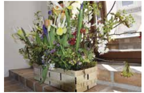
...pod autorstvím je podepsán Václav Straka se svým týmem

Veliké poděkování patří i všem, kteří se jakkoliv podíleli na zdárném průběhu dvou konferenčních dnů, jejichž hlavním smyslem byla výměna zkušeností na poli výsadby květin v centrech měst.