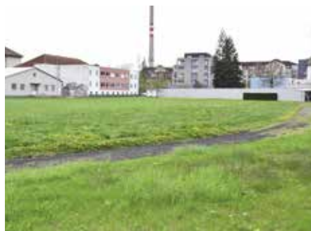
Současný uzavřený atletický ovál

Běžecká trať je již rok uzavřena z důvodů nerovného škvárového povrchu dráhy a nevhodných betonových obrubníků. Po dešti se zde tvoří kaluže a povrch je značně za léta používání poničen. Kvůli tomu má škola kapacitně velmi omezené a nevyhovující prostory pro realizaci školní tělovýchovy.