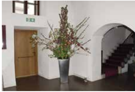
Květinová výzdoba nesměla na konferenci chybět

Secce Správa zeleně se věnuje tématu využití a použití květin ve veřejných výsadbách. Středa 26. dubna se nesla v duchu šňůry jednotlivých přednášek na rozličná témata. Ve čtvrtek byly pro účastníky připraveny exkurze napříč městem, při nichž navštívili záhony s kvetoucími cibulovinami. Naši zahradníci nevynechali ani ukázkou technologie mulčování trvalkových záhonů vlastní biomasou, či mechanickou výsadbu cibulovin v trávniku. Bez zajímavosti není, že ta se poprvé realizovala v roce 2011. V letošním roce takto vsazené cibulky dělají parádu již dvanáctým rokem.