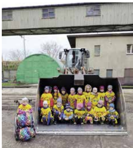
Z exkurze strakonické teplárny

Protože jsme letos už měli dlouhé a nekončící zimy „dost“, rozhodli jsme se ji „vyprovodit“. Jako každý rok jsme společně vyrobili jednu velkou Morenu, kterou jsme ozdobili a za doprovodu říkadel donesli na Barvínkov. Tam jsme ji na lávce nad řekou Volyňkou zapálili a hodili do řeky. Do řeky následně putovaly i malé, dětmi vlastnoručně vyrobené, Morenky z přírodních materiálů.