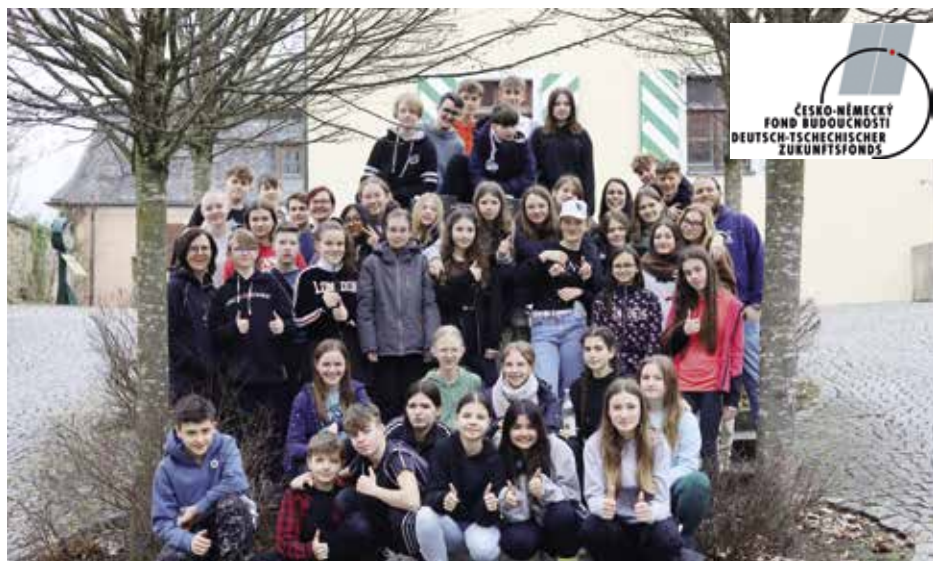
Osmáci a devátáci si procvičili nejen německý jazyk