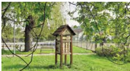
Věž poznání na Vrtě zpříjemní putování hlavně mladším generacím