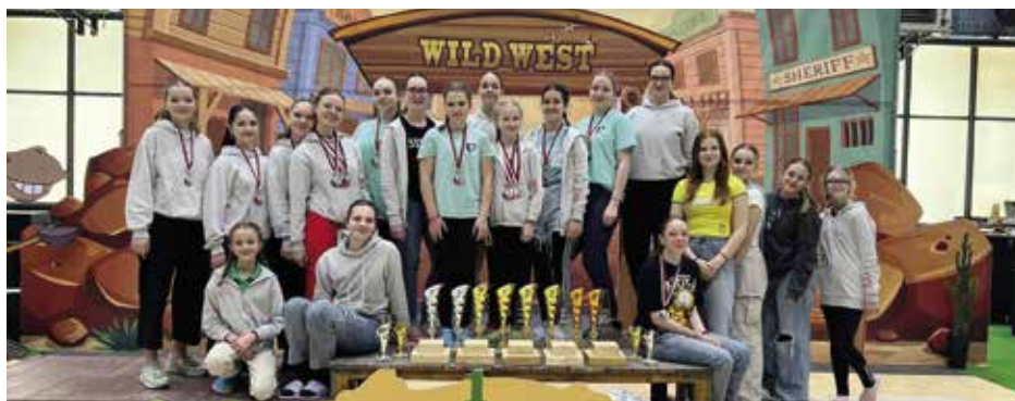
Tanečnice z ROZÁLIE si odvážely poháry