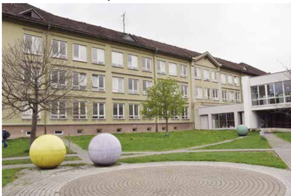
Jihovýchodní strana školy, kde budou vyměněna okna