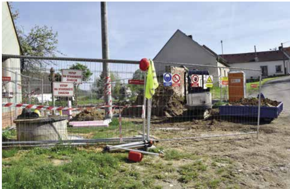
Práce na novém veřejném prostranství začaly

V loňském roce bylo rozhodnuto o realizaci úpravy veřejného prostranství Střela. Na dubnovém jednání rada města schválila Dohodu o poskytnutí dotace z Programu rozvoje venkova ČR na realizaci projektu „Úprava veřejného prostranství Střela“ mezi městem Strakonice a Státním zemědělským intervenčním fondem.