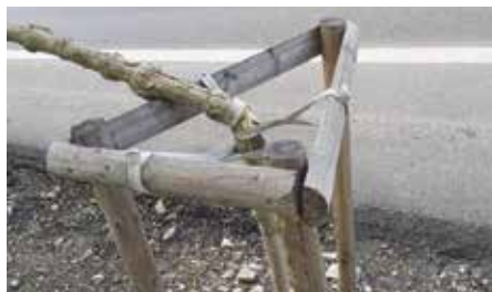
Zlámání stromky v Katovické ulici

S prvním teplým večerem vyplněným posezením a notnou dávkou alkoholu se naplno projevil víkendové řádění vandalů, kterému