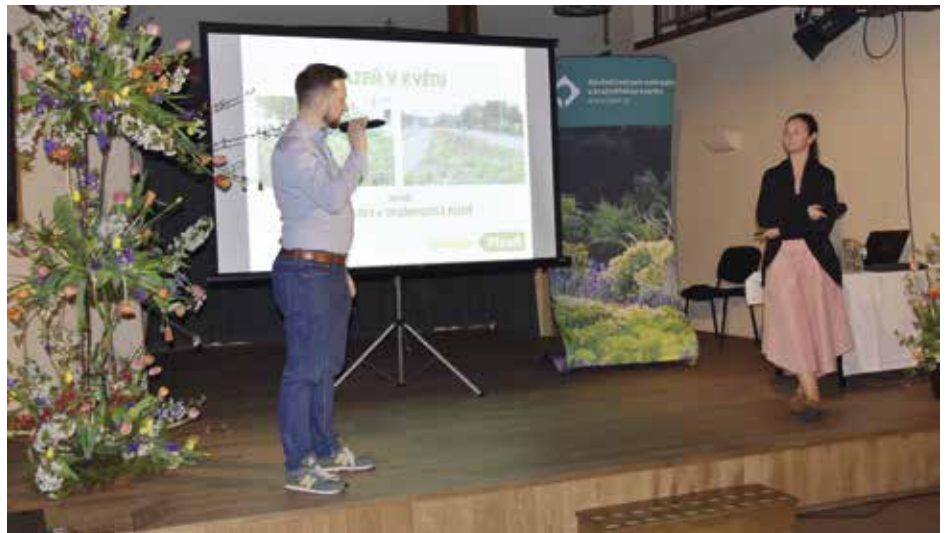
Středa byla ve znamení přednášek