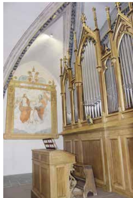
Varhany po rekonstrukci

Náš nástroj je v novogotické (resp. pseudogotické) skříni, přenos je mechanický. Má dva manuály a pedál; 18 rejstříků, z toho 9 v hlavním manuálu, 5 v druhém a 4 pedálové. Celkem obsahuje 1134 píšťal, největší píšťala je dlouhá 5 m a nejmenší 4 cm. Zhotoveny jsou z kovu (cín, zinek) a dřeva (kombinace smrk, borovice, dub dle velikosti). Ladění varhan je v rovnoměrné teplotě 440 Hz při 14 °C, tzn. ideální stav pro koncerty v zimě. Při stavbě se použilo 5 m 2 teletic kůže. Při restaurování v letech 2020–22 provedeném varhanářem Peterem Nožinou proběhlo rozebrání skříně a celého nástroje, vyčištění,