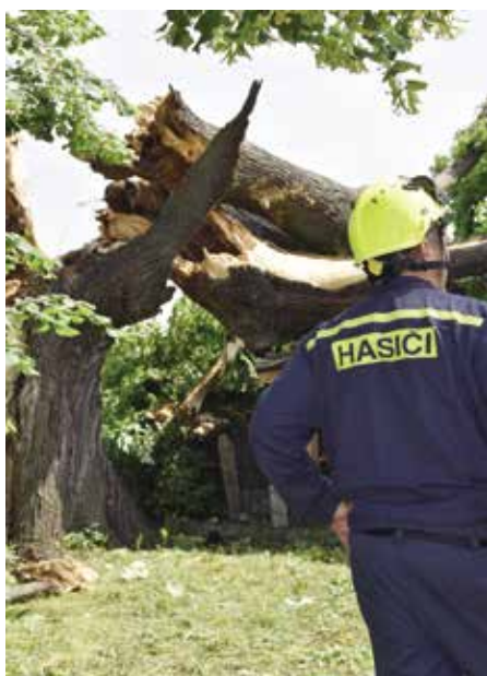
Poděkování patří všem, kteří pomohli