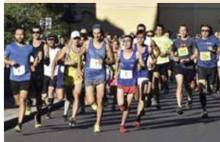
Závodníci na trase

Přihlášky k běhu 21. srpna je možné podávat pouze elektronicky na adrese: www.strakonickybeh.cz/prihlaseni-a-odhlaseni/ .