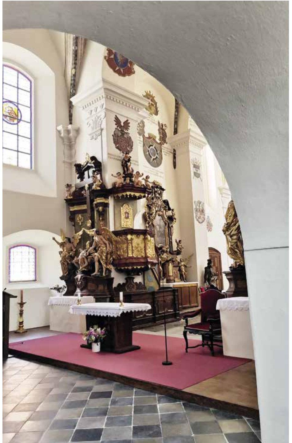
Jeden z oltářů v kostele sv. Prokopa