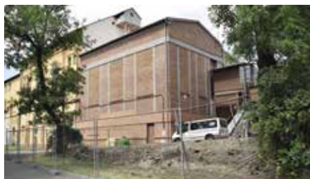
V těchto místech vyroste nová veřejná toaleta

Ve druhé polovině července začala stavba dalších automatické toalety, tentokrát pod pivovarem. Jedná se o území hojně využívané turisty, ale i místními obyvateli k odpočinku a umístění veřejných toalet je zde zcela namístě. V ne-