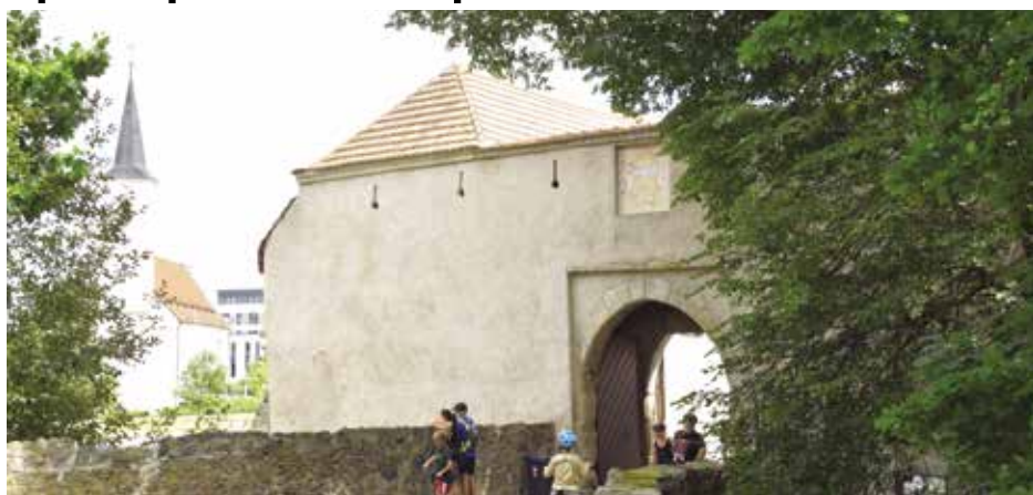
Po opravě už erb Bavora I. nepřehlédnete