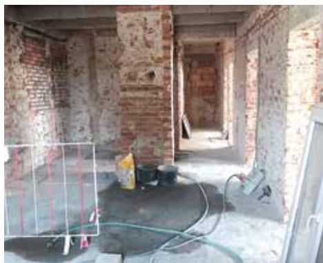
Snímky z fáze výstavby