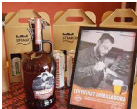
Certifikát ambasadora se džbánkem

V pořadí již pátý řemeslník si z Pivovaru Strakonice 1649 odnesl certifikát ambasadora, ke kterému náleží jako bonus poukaz na 365 lahví piva a džbáněk s vlastním řemeslným pivem.