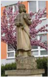
Socha před ZŠ

Seriál o strakonických sochách pokračuje a my jsme se sochou Jiřího z Poděbrad posunuli do jeho druhé poloviny.