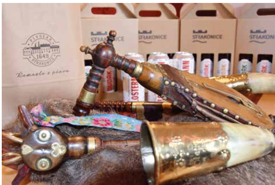
Pivovarské „Řemeslo s pěnou“ oceňuje zručné lidi

Ovšem když si jeho děda pořídil soustruh, dodal si odvahy a nesměle začal zkoušet první součástky vyrobit. Většina z nich ale končila v kamnech. „Neměl jsem kde se na techniku výroby zeptat. V Čechách je jen asi pět dudařů a z toho tři v pokročilém věku.“ A tak nezbyvalo než se obrnit trpělivostí, využít obyčejného selského rozumu a metodou pokus–omyl se pomalu dobrat k prvnímu nástroji.