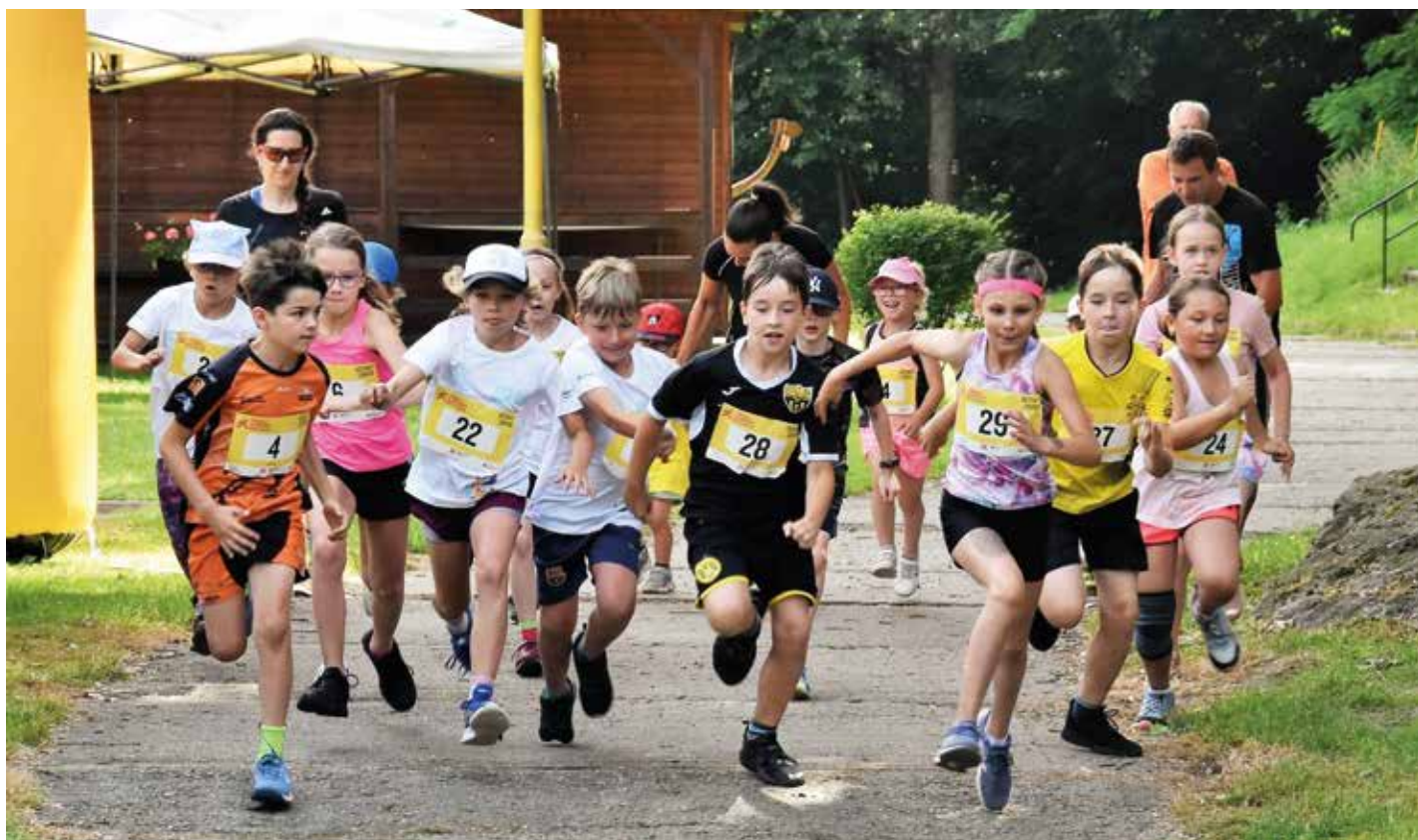
Start dětské kategorie