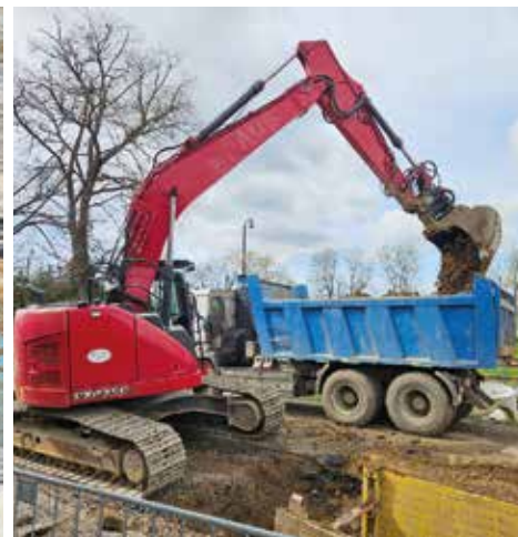
Volyňská - pokládka potrubí

Podle harmonogramu pokračuje rozsáhlá rekonstrukce Volyňské ulice. Vzhledem k tomu, že tato rekonstrukce do jisté míry ovlivňuje chod města, a to především po stránce dopravních situací, chceme transparentně informovat o probíhajících opravách. Sdílíme informace na sociálních sítích a totéž chceme zveřejňovat i v tištěném prostoru.