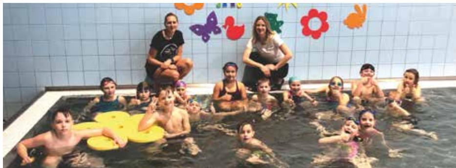
Děti se cítily jako ryba ve vodě