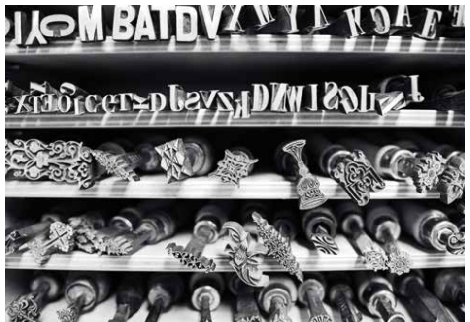
Pohled do Knihodělny