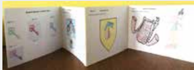
Kvizové leporelo ověřuje znalosti dětí o našem městě

Školní družina při ZŠ Strakonice, Krále Jiřího z Poděbrad nabídla dětem ve školním roce 2023/24 v rámci zájmového vzdělávání celoroční vědomostní hru s názvem „Odemkni své město Strakonice“.