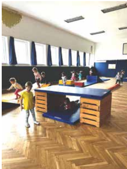
Ze cvičení se Sokolem

V naší mateřské škole Strakonice, Lidická 625 jsme se v letošním školním roce více zaměřili na zdravou výživu. Po dohodě s rodiči se snažíme dětem nabízet spíše cereálie a ovoce jako alternativu sladkostí při oslavách dětských narozenin, svátků a při různých akcích školy. Školní jídelna nám omezila sladké nápoje, čaj sladíme v nejmenší míře.