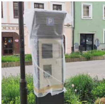
Nové parkomaty v době instalace