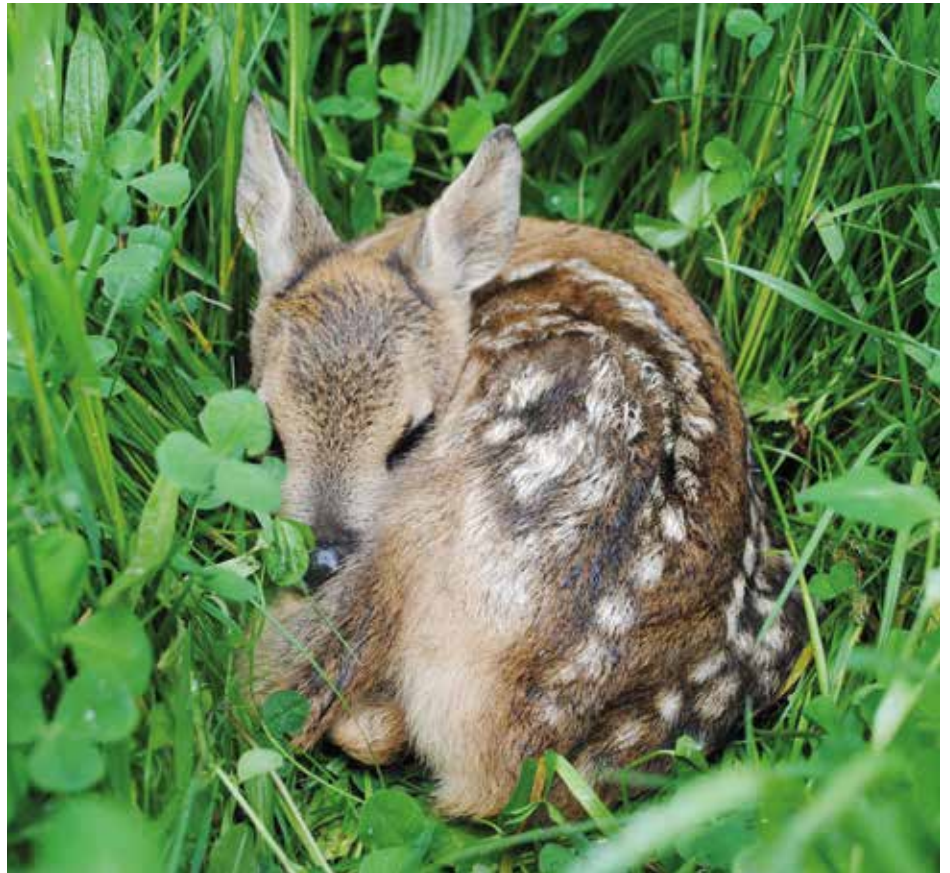
Pomozte chránit malá srnčata