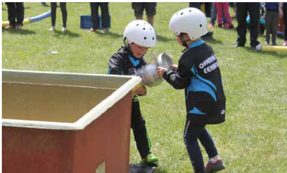
Vidíte to nasazení malých soutěžících?