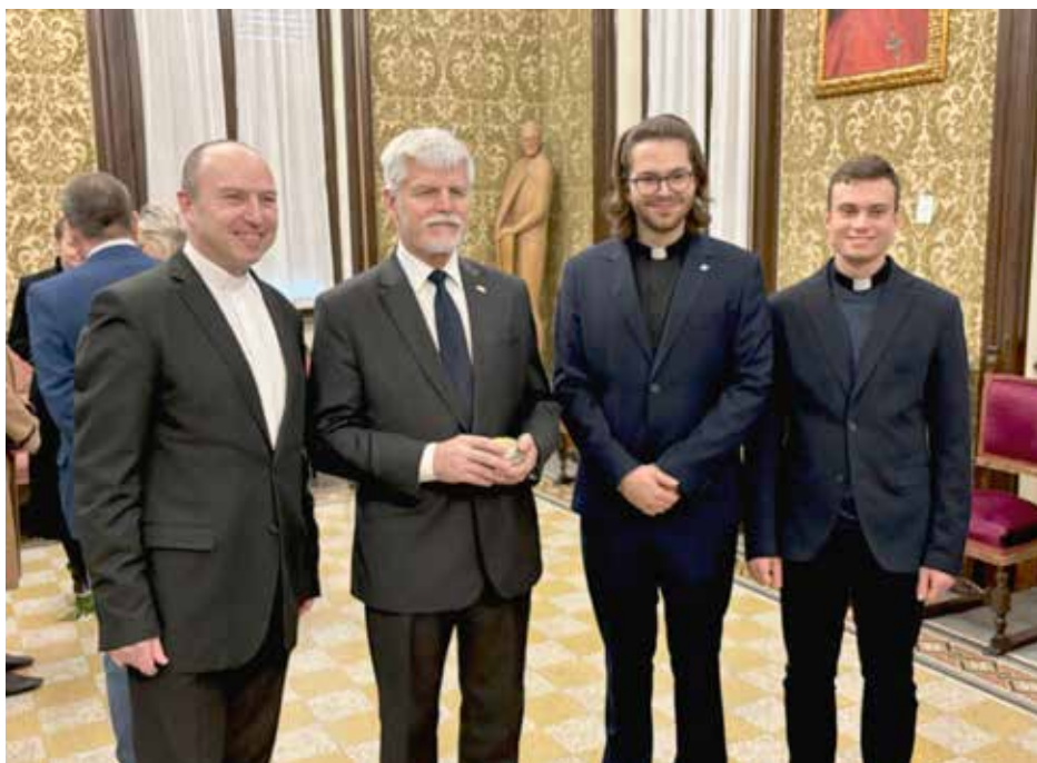
Prezident s komunitou českých kněží a bohoslovců